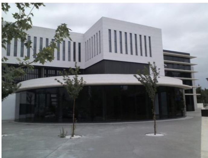
FACULTAD DE CIENCIAS SOCIALES Y HUMANAS, TERUEL

Valga esta introducción para ponerme en situación sobre cual ha sido mi proceso formativo a lo largo de casi 9 meses.