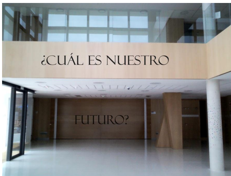
REFLEXIÓN. FOTOMONTAJE EN LA PLANTA BAJA DE LA FACULTAD DE CIENCIAS SOCIALES Y HUMANAS DE TERUEL

Los sistemas educativos han sufrido reformas continuas, en la práctica escasamente satisfactorias. El desafío actual es preparar a los ciudadanos para afrontar la cambiante, incierta, compleja y profundamente desigual sociedad contemporánea en la era de la información y de la incertidumbre. La formación de los ciudadanos contemporáneos parece requerir la traslación desde un currículum disciplinar de acumulación y reproducción de datos, a un currículum abierto y flexible, basado en situaciones reales, complejas, inciertas y problemáticas.