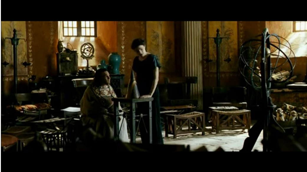
FOTOGRAMA DE LA PELÍCULA “ÁGORA”, DE ALEJANDRO AMENÁBAR

Se visionó una breve secuencia de la película Ágora en la que adquiere protagonismo el cono de Apolonio y se comentó brevemente quién es Apolonio de Perge. A través de un PowerPoint se visionaron varias imágenes de importantes edificios arquitectónicos y se reconocieron en ellas las curvas cónicas. Concluimos el debate abierto.