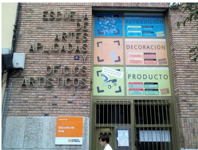
ESCUELA DE ARTE, TERUEL

La Unidad Didáctica “Curvas Cónicas” fue impartida en la Escuela de Arte de Teruel a alumnos de 1º de Bachillerato (en número no superior a 15), durante 4 sesiones que pertenecen a la asignatura Dibujo Técnico I en su tercer trimestre. El aula disponía de mesas de dibujo, proyector, ordenador, conexión a internet, encerado y utensilios de dibujo.