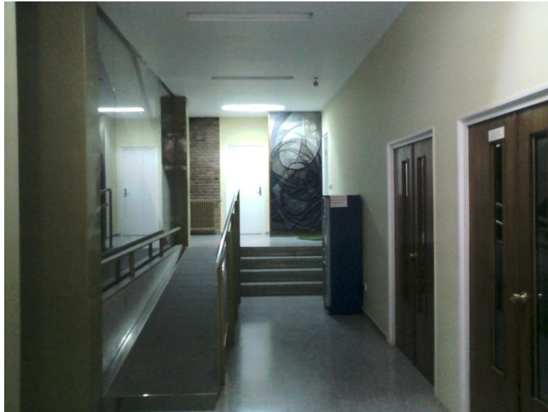
ESCUELA DE ARTE DE TERUEL. LUGAR DONDE REALICÉ LOS PRÁCTICUMS I, II Y III