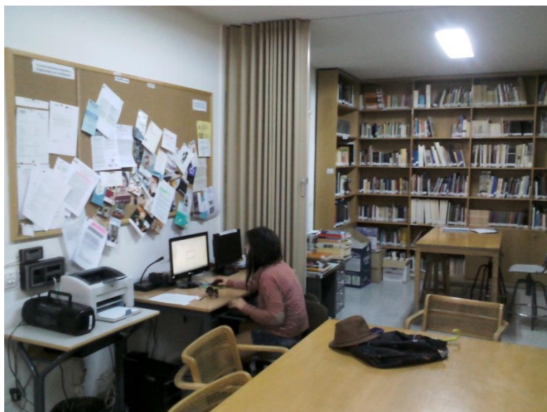
BIBLIOTECA DE LA ESCUELA DE ARTE, TERUEL