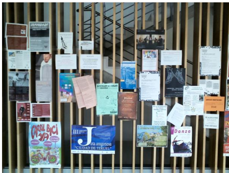
LA ENSEÑANZA, UN PROCESO SOCIAL. TABLÓN DE ANUNCIOS DE LA FACULTAD DE CIENCIAS SOCIALES Y HUMANAS DE TERUEL

Enseñar hoy, desde la escuela, es más que una práctica cognitiva e intelectual, es también un proceso social. Los docentes saben que los procesos de enseñanza aprendizaje constituyen una práctica social y emocional donde lo fundamental es el proceso de comunicación que se establece dentro y fuera del aula con los alumnos, donde las emociones y las motivaciones son partes integrantes y fundamentales del proceso educativo. En este momento la historia de la educación viene marcada por un mundo en continuo cambio, que experimenta profundas transformaciones y en el que toda la población está escolarizada de manera obligatoria durante diez años, de los cuales, cuatro pertenecen a la Educación Secundaria. Esto nos hace pensar que aquellos que se inician en la profesión docente de Secundaria, deben hacerlo conociendo la realidad de las aulas, y que los que se integraron en épocas anteriores, deben adaptarse, prepararse y reciclarse para esta nueva Secundaria. 2