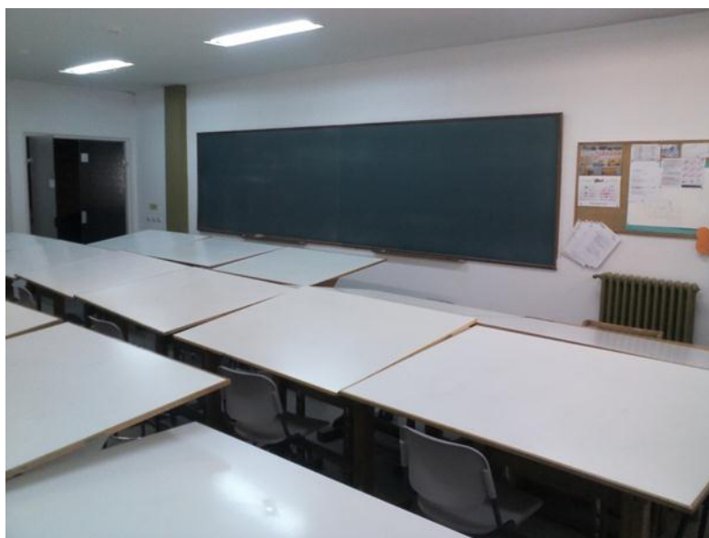
AULA DE DIBUJO TÉCNICO EN LA QUE IMPARTÍ MIS CLASES

3) En la Sesión 3, recogí los ejercicios pedidos y atendí a las dudas que se generaron en casa. Los propios alumnos fueron los que ayudaron a sus compañeros a aclarar sus dudas. Con ayuda de un alumno dibujé la elipse por el método de la intersección de rectas. El resto de compañeros dibujaron también la elipse por el método de la intersección de rectas, y aquellos que no lo tenían claro o estaban perdidos dieron el relevo a su compañero en el encerado. Con el mismo “modus operandi” se dibujó una elipse por el método de los diámetros conjugados. De cara a la próxima sesión dibujaron una elipse por uno de los métodos que fueron explicados. Se les facilitó ejemplos de elipses bien dibujadas, con una correcta presentación y acabado.