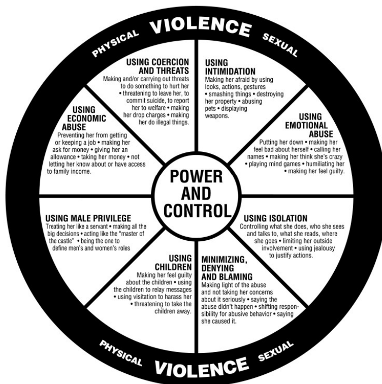
Figur 1. Power and Control Wheel, (Peymar & Pence 1993 s.3).

Motståndsvåld. Motståndsvåldet förklarades av Johnson (2008) som det våld som är en reaktion på en våldssituation och då ofta en reaktion på terrorvåldet. Motståndsvåldet är ett sätt att skydda sig men i motståndsvåldet kan det också finnas förhoppning om, att slår jag tillbaka så upphör det fysiska våldet, menade Johnson (2008). Motståndsvåldet kan också vara ett sätt att försöka kommunicera, att detta du gör mot mig är inte okej - jag kommer att kämpa tillbaka.