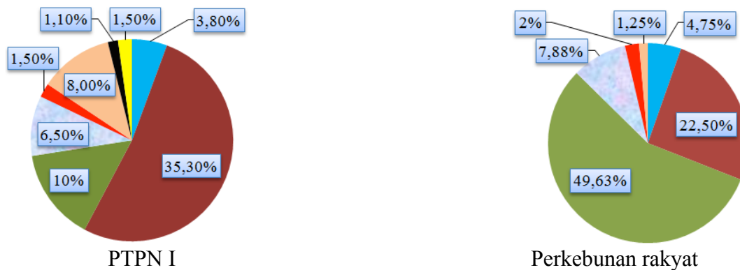
Gambar 1 dan 2. Persentase spesies AMF yang ditemukan di perkebunan PTPN I dan perkebunan Rakyat

diisolasi dari dua tipe pengelolaan perkebunan kelapa sawit pada empat kelompok umur tanaman. Delapan spesies ditemukan pada PTPN I dan enam spesies pada perkebunan rakyat (Gambar 1 dan 2). Dari delapan spesies spora FMA yang ditemukan, enam spesies ( Glomus sp.1, Glomus sp. 2, Glomus sp.3, Glomus sp.4, Glomus sp.5, dan Glomus sp.6) ditemukan pada kedua tipe perkebunan. Spora FMA terbanyak yang dijumpai pada PTPN I adalah Glomus sp. 2 sedangkan pada perkebunan rakyat adalah Glomus sp. 3. Tipe spora yang diperoleh memiliki ciri-ciri bentuk, ukuran, dan warna spora yang berbeda-beda (Gambar 3).