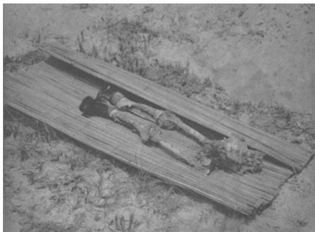
Figura 1: Vítima Não identificada do U-570. 1942.

Imagens como essa impactavam a população sergipana, que como já foi dito não tinha a experiência de sepultar tantos mortos em um só momento 10 . Assim, o terror era uma construção discursiva, por meio de narrativas diárias no âmbito da imprensa e do uso imagético dos corpos dilacerados. A guerra adentrava os lares por meio da imprensa. O odor dos corpos em putrefação era propagado pelos registros fotográficos e matérias que apelavam para uma reação popular. Neste sentido, o terror era uma construção discursiva, na qual a guerra transmutava-se em personagem do cotidiano da população. O jornal Folha da Manhã contabilizava a chegada dos cadáveres, aumentando o sensacionalismo sobre a difícil situação.