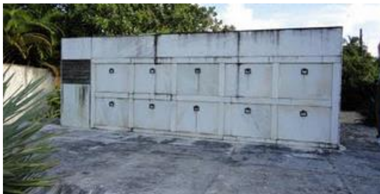
FIGURA 5: Túmulos simbólicos construídos pelo Ministério da Marinha, em 1972. Registro fotográfico do autor, 2012.

O monumento simples, construído em 1972, teve como patrocinador o Ministério da Marinha, ou seja, partiu de uma política cultural do Estado no intuito de se constituir uma memória oficial. Era um lugar de memória que expressava a leitura proeminente do Estado nacional, desprovido de face e nomeações que elucidassem a presença do indivíduo. O monumento erigia o protagonismo das forças armadas e enaltecia o nacionalismo por meio da inscrição de sua placa: “Cemitério dos Náufragos dos navios mercantes Baependi, Araraquara e Aníbal Benévolo. ‘Aí está o golpe mais traiçoeiro e terrível vibrado contra o coração da nacionalidade’”. Ainda na década de 70 do século XX, o governo estadual construiu uma rodovia ligando Aracaju ao litoral sul, denominada Rodovia dos Náufragos. É interessante observar que a Rodovia dos Náufragos não passava pelo cemitério, pois estava localizado a cerca de cinco quilômetros da Rodovia a beira-mar, onde está localizado o Cemitério dos Náufragos e que ironicamente foi denominada de Rodovia José Sarney.