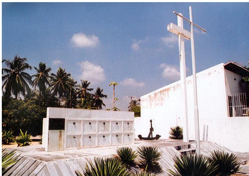
FIGURA 6: Túmulos simbólicos construídos pelo Ministério da Marinha, em 1972.

O Cemitério dos Náufragos tornou-se um dos primeiros monumentos reconhecidos como patrimônio histórico no Estado de Sergipe. Representava a monumentalização da memória dos ataques dos submarinos alemães e da reação da Marinha Nacional. O lugar de memória respalda-se no uso de uma simbologia que associa as forças armadas ao martírio, com a âncora e a cruz. Observe a Figura VI 17 :