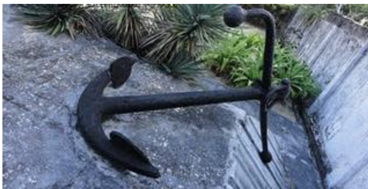
FIGURA 4. Âncora no Cemitério dos Náufragos e a construção da memória da Marinha Brasileira. Registro fotográfico do autor, 2011.

No cemitério a simbologia da marinha foi exposta, corroborando para a construção da memória que supostamente enaltecia as vítimas dos atentados, que como já vimos eram cidadãos civis. No entanto, o Cemitério dos Náufragos, como monumento histórico revela outra memória. As vítimas dos algozes alemães não foram os passageiros, mas sim a própria Marinha. A memória construída pelo Estado expressa a Marinha brasileira como principal alvo dos ataques, ou seja, ela foi eleita a heroína da nova memória edificada, como consta a Figura IV 15 .