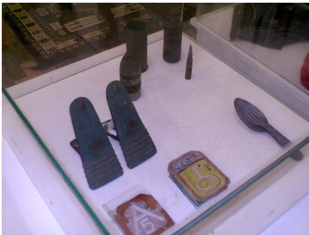
FIGURA 7: Objetos dos pracinhas brasileiros na II Guerra Mundial.

episódios históricos locais, com ênfase para a família imperial e para os objetos oriundos da II Guerra Mundial, como pode ser observado na Figura VII 18 .