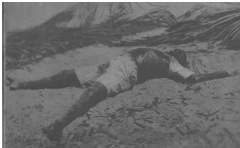
Figura 2: Vítima não identificada do Aníbal Benévolo. Agosto de 1942. Acervo do Arquivo da Cidade de Aracaju.

Corpos ultrajados nas praias desertas de Aracaju e Estância criavam um cenário desolador para os moradores. A decomposição dos naufragos e a ação da comunidade no sepultamento dos mesmos aumentaram o desencontro das informações, incluindo o número total de vítimas dos navios torpedeados no litoral sergipano. A situação de horror somente foi amenizada com a notícia que todos esperavam, vista como a primeira reação brasileira aos ataques dos submarinos alemães que supostamente humilhavam a soberania nacional. Foi a destruição do U-570, submarino que tinha torpedeado cinco navios entre Sergipe e Bahia em apenas dois dias. A vitória foi cantada na imprensa,