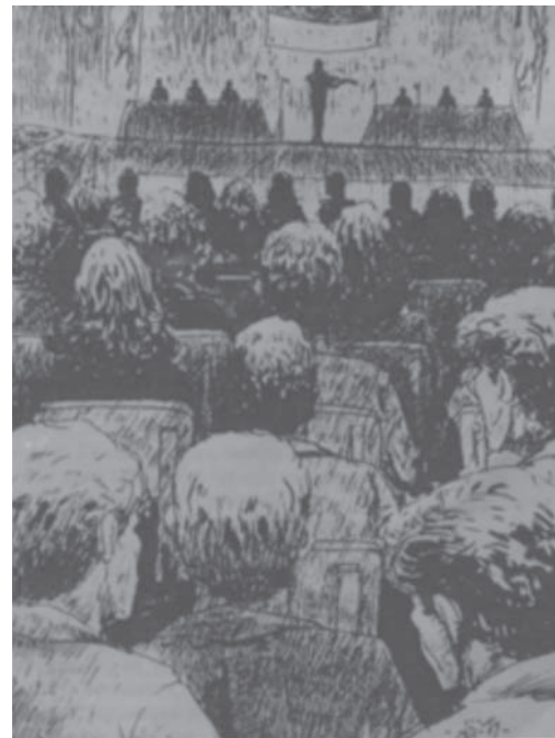
Gambar 1. W.R. Supratman dan Lagu 'Indonesia' di Gedung Kramat 106 Jakarta kongres Pemuda 28 Oktober 1928, rekonstruksi ilustrasi gambar Aji Soemarno P. 1982. (Sumber: Bambang Sularto Lagu Kebangsaan Indonesia Raya . Jakarta:Depdikbud, 1982, 62)

Penciptaan lagu kebangsaan dengan semangat patriotisme merupakan upaya menyampaikan pesan konstruktif melalui musik. Harus diakui bukanlah pekerjaan mudah menghasilkan serangkaian lirik penuh makna di sebaliknya dengan ilustrasi musik yang menyertainya. W.R. Supratman sebagai pemuda ikut mendorong semangat perjuangan lewat lagunya setelah melalui lobby yang cukup panjang dengan para pemuda (Ganap, 2009:17). Dengan diilhami cita-cita kebangkitan nasional Boedi Utomo 1908, pada tanggal 28 Oktober 1928 yang mengikrarkan sumpah pemuda, yaitu satu nusa, satu bangsa, dan satu bahasa. Kesempatan itu dipergunakan oleh Supratman memperkenalkan lagunya di dalam ruang peserta kongres pemuda di gedung Indonesische Club , Kramat 106 Jakarta. Betapa hebatnya lagu disambut peserta dan beliau menerima ucapan selamat dari rekan-rekannya.