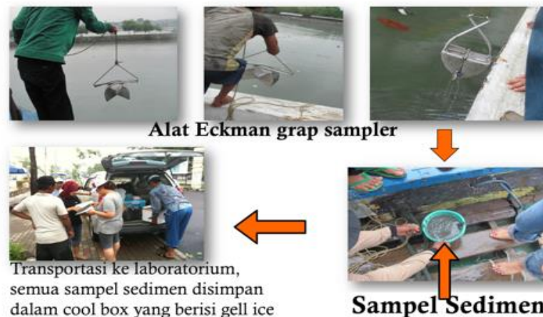
Gambar 2. Sampling sedimen sampel

tabung 50 mL polietilen dan selama transportasi disimpan dalam cool box (Gambar 2). Selanjutnya sampel disimpan beku pada suhu -20^{\circ}\text{C} sampai dilakukan analisis TBT.