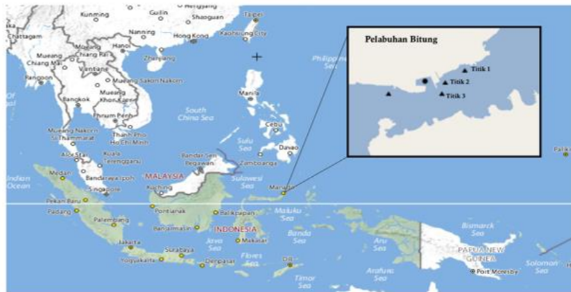
Gambar 1. Lokasi pengambilan sampel sedimen