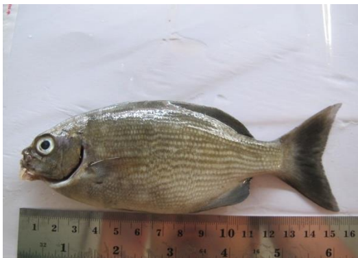
Gambar 3. Chubs Fish.

Ciri-ciri ikan ini memiliki panjang maksimal 75 cm, badan abu-abu keperakan kadang ada juga yang kuning dan putih albino. Garis yang terbentuk antara sirip ekor dan sirip anal lebih tegak dibandingkan K. vaigiensis . Habitat di daerah terbuka di lereng karang dan kadang di daerah dangkal dan karang berbatu. Range kedalaman 1-25 m. Distribusi ikan ini Indo-Pasifik, Merah, Timur Afrika, timur dan barat Australia, Kepulauan Lord Howe dan rapa dan Jepang. Ikan ini tipe pemakan Bentik alga, ( Sargassum dan Turbinaria ) bentik krustacea, cacing.