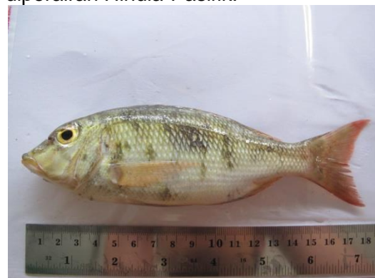
Gambar 6. Lethrinus species .

Ikan lecam Lethrinus spp merupakan ikan demersal kecil yang banyak tersebar di seluruh Indonesia. Ikan lecam Lethrinus spp merupakan ikan laut komoditas penting. Ikan lecam dapat diolah dan digunakan sebagai ikan asin, ikan kering, baso ikan, tempura ikan, dan lain-lain. Pemanfaatan ikan lecam sebagai olahan makanan di Indonesia telah mencapai tingkat ekspor. Tangkapan ikan Lencam di Indonesia terdapat hampir di seluruh pelabuhan perikanan di Indonesia. Sampai saat ini Ikan Lencam belum dinyatakan sebagai spesies yang terancam keberadaannya karena spesies ini tersebar hampir diperairan Hindia-Pasifik.