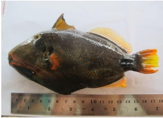
Gambar 2. Trigger Fish.