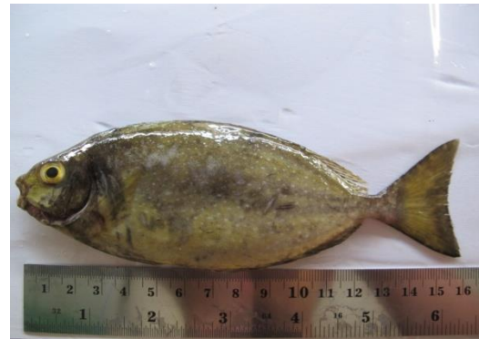
Gambar 4. Siganus Canaliculatus .

Distribusi di Asia Tenggara, Indo-Pasifik.