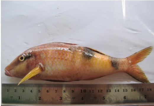
Gambar 5. Ikan biji nangka.

juga sering menangkap ikan ini dengan alat Jaring Tarik. Ikan ini sebenarnya bisa mencapai ukuran 60 cm, namun lebih sering tertangkap pada panjang sekitar 30 cm. Jumlah spesies yang ditemukan di wilayah Pasifik Barat mencapai 29 jenis, semuanya tercatat ditemukan di Indonesia. Jumlah yang tercatat ditemukan di Indonesia mencapai 29 jenis.