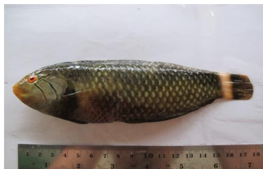
Gambar 8. Novaculichthys taeniourus .

abu-abu dengan garis coklat tua yang tidak teratur dari mata, 2 bercak hitam di bagian depan sirip punggung, pita/garis putih tegak yang lebar di dasar sirip ekor, bagian belakang sirip ekor hitam, sirip perut hitam. Ikan-ikan muda bercorng dan berwarna coklat, kemerahan, atau hijau, dengan bercak putih. Ikan jenis ini dapat mencapai panjang 30 cm. Ikan-ikan muda menyerupai rumput laut yang hanyut. Distribusi ikan ini di Indo-Pasifik.