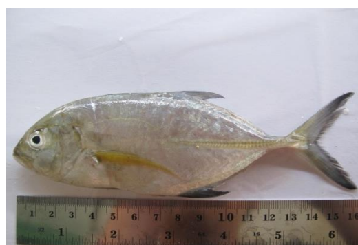
Gambar 1. Bobara.

lepas). Alat tangkap yang paling dominan adalah Purse Seine dan Gill Net (sebagian kecil). Untuk jenis ikan Kuwe yang terdapat di terumbu karang, alat tangkap paling dominan adalah Pancing dan jaring Muro Ami. Di Indonesia, produksi ikan Kuwe terutama dijual segar dan untuk pindang. Ukuran yang tertangkap sangat beragam, tergantung dari spesiesnya. Jenis perikanan ini sangat penting bagi nelayan untuk pasar lokal dan domestik. Jumlah yang tercatat ditemukan di Indonesia 36 jenis ikan.