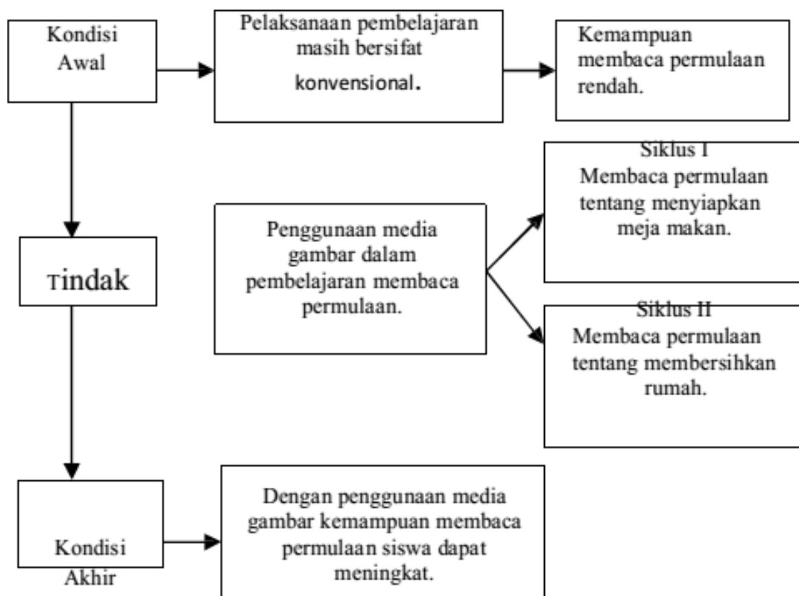
Gambar 1. Kerangka Berfikir

Penggunaan media gambar diharapkan dapat membuat siswa merasa tertarik dengan pelajaran membaca permulaan, sehingga daya pikir siswa menjadi lebih tajam, dan siswa akan dapat membaca dengan lancar sehingga kemampuan membaca permulaan siswa menjadi meningkat. Berdasarkan uraian di atas, maka dapat dibuat skema kerangka berfikir seperti pada gambar 1.