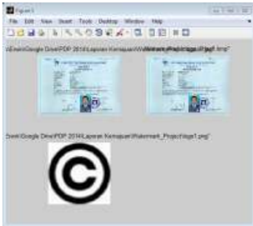
Gambar 6. Tampilan hasil proses Insert Watermark