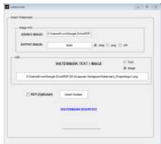
Gambar 5. Tampilan proses setelah watermark disisipkan