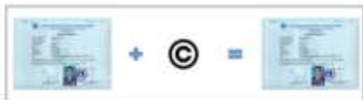
Gambar 2. Berkas softcopy ijazah dan watermark yang disisipkan

Pada penelitian ini, sistem secara umum terbagi ke dalam beberapa bagian. Pertama adalah modul watermarking . Bagian ini digunakan oleh pihak internal kampus untuk menyisipkan satu buah citra tanda air ( watermark ) ke dalam berkas ijazah yang disimpan dalam bentuk softcopy . Watermark tersebut digunakan untuk verifikasi keaslian ijazah, yang hanya diketahui oleh perguruan tinggi penerbit. Sebagai contoh, gambar 2 menunjukkan citra digital ijazah atau original image (kiri), watermark , dan ijazah yang sudah mengandung tanda air di dalamnya, atau watermarked image .