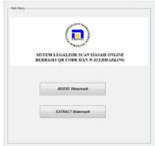
Gambar 4. Tampilan Menu Utama watermarking

Sesuai dengan gambaran umum, maka sistem ini juga memiliki beberapa antarmuka yang dapat digunakan oleh user . Gambar 4 menampilkan menu utama dari antarmuka proses watermarking . Pada menu ini, user dapat melakukan proses penyisipan watermark seperti pada gambar 5 dan ekstraksi watermark yang disajikan pada gambar 8. Jika watermark berhasil disisipkan, maka gambar 6 akan memberikan keterangan. Sedangkan gambar 7 memperlihatkan proses dan hasil dari penyisipan watermark .