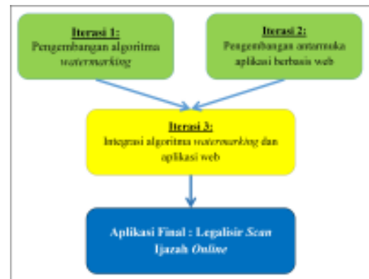
Gambar 1. Metode Penelitian

Sebagaimana ditunjukkan pada gambar 1, iterasi 1 (algoritma watermarking ) dan iterasi 2 (aplikasi berbasis web) bersifat independen sehingga dapat dikerjakan secara konkuren , sedangkan iterasi ketiga yaitu integrasi watermarking dan aplikasi berbasis web harus menunggu kedua iterasi sebelumnya selesai dikerjakan.