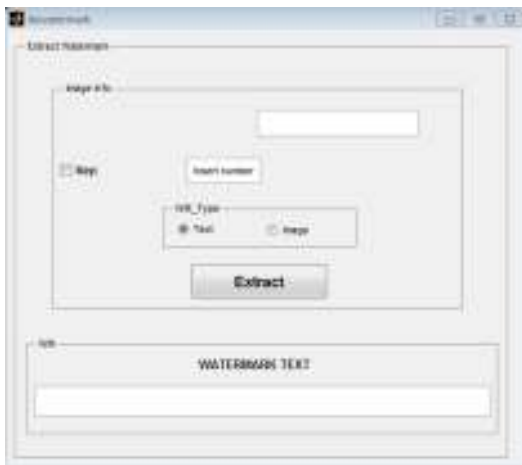
Gambar 7. Tampilan proses Extract Watermark