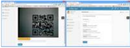
Gambar 3. Validasi menggunakan QR-Code dan unggah berkas

Baik validasi hardcopy maupun validasi softcopy akan menautkan hasilnya ke halaman detail biodata dan transkrip mahasiswa yang tersimpan pada basis data universitas. Hal ini untuk memberi informasi secara lengkap pada instansi mitra profil mahasiswa terkait selama menjadi mahasiswa di universitas.