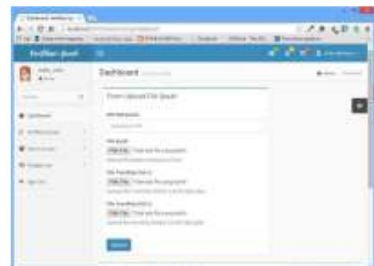
Gambar 11. Halaman unggah berkas ijasah untuk validasi