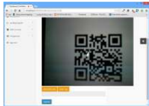
Gambar 10. Halaman pemindai QR-Code online