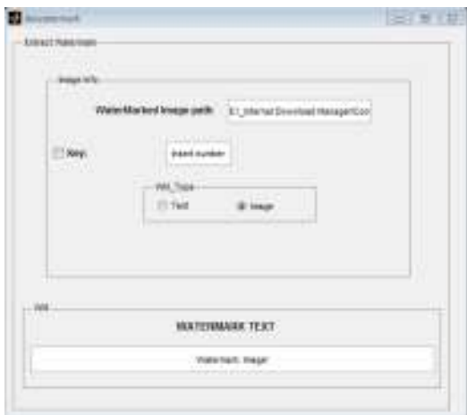
Gambar 8. Tampilan setelah watermark diekstrak

Gambar 9 di atas merupakan antarmuka yang diperlihatkan setelah ekstraksi watermark selesai, dengan tanda air yang diekstrak disajikan pada gambar 10.