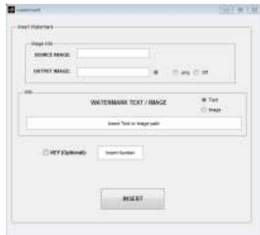
Gambar 4. Tampilan utama proses Insert Watermark