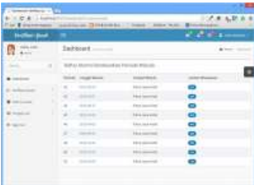
Gambar 13. Tampilan rekapitulasi lulusan per periode wisuda

Aplikasi berbasis web digunakan untuk berhubungan dengan pengguna akhir eksternal universitas. Pada aplikasi ini ada beberapa fitur utama yang berhubungan dengan validasi ijazah secara online yaitu: verifikasi ijazah via scan QR-Code, verifikasi ijazah via upload berkas digital, download berkas ijazah terlegalisir, data lulusan, serta halaman pengaturan.