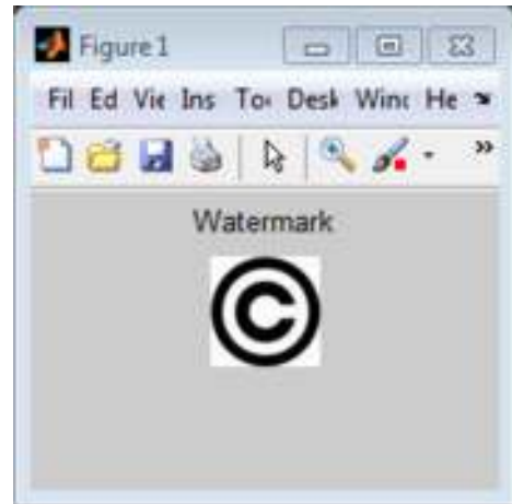
Gambar 9. Tampilan watermark yang berhasil diekstrak