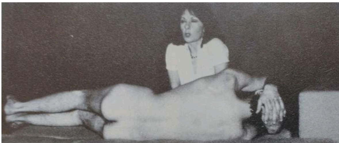
Fig. 7: foto di scena di Dialogo di una prostituta con un suo cliente di Dacia Maraini ( effe , IV/7-8, 1976)

A livello discorsivo, nel teatro militante come nella scelta editoriale della rivista per la propria copertina, si tratta di irridenti strategie di inversione dei ruoli 31 .