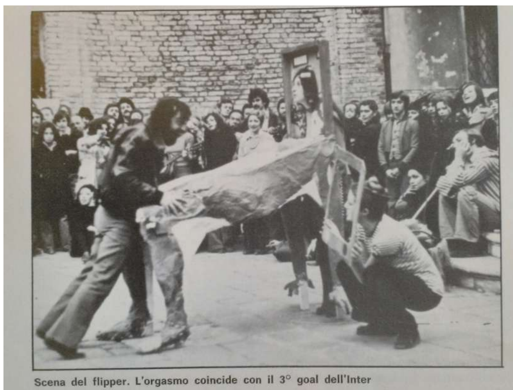
Fig. 8: fotografia di una performance femminista a Venezia (donna-flipper), effe , III/4, 1975

decostruiscono cliché, stereotipi, comportamenti e maschere del femminile: in particolare la rivista registra a tutto campo le spassose invenzioni sceniche dei teatri militanti nella forma diffusa del teatro di strada e della performance occasionale e d'intervento 32 . Ad esempio, un'immagine documenta l'ironica scena di strada di uno «spettacolo-happening» che il collettivo comunista femminista inscena in un campiello veneziano l'otto marzo del 1975, aggregando divertiti passanti. Con pochi ed efficaci oggetti scenici e una prossemica stile agit-prop, attiviste e attivisti mimano un marito che arranca intorno ad una donna-flipper, eccitato dalla partita di calcio trasmessa dalla televisione: «l'orgasmo coincide con il terzo goal dell'Inter», racconta la didascalia (figura 8) 33 .