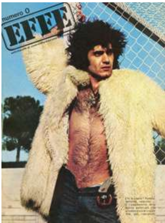
Fig. 6: Copertina di effe , a. I, n.0, 1973

Assolutamente nessuno. È l'equivalente delle donne seminude che si vedono sulle copertine dei rotocalchi» 28 . Anche questo scatto era di Agnese di Donato, e Cambria racconta divertita che il giovane attore che aveva posato per lei si arrabbiò moltissimo del commento femminista apposto alla sua immagine 29 .