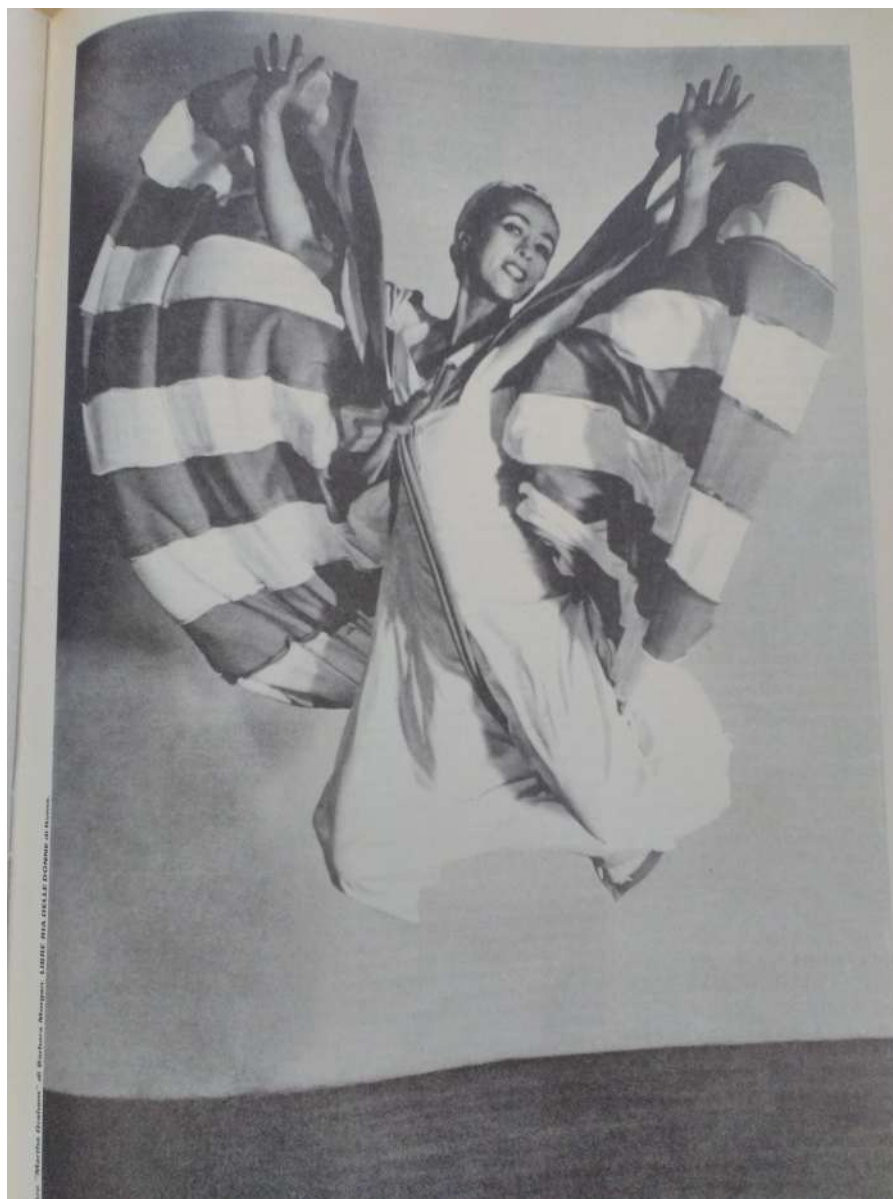
Fig. 10: Corpo danzante, desiderio, libertà: un'immagine a piena pagina ( effe , a. VII, n. 6, 1979)