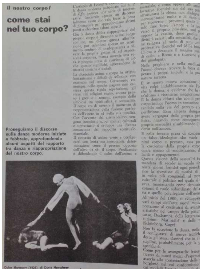
Fig. 9: Articolo dedicato alla danza, effe , VI/3, marzo 1978

«come valida alternativa per riacquistare la coscienza di un corpo dimenticato, umiliato, sfruttato» 47 . L'intervento è illustrato con immagini di corpi danzanti; (da un lato una coreografia di Doris Humphrey (figura 9), nella pagina accanto fotografie del gruppo Bella Hutter di Torino, una realtà di grande interesse per la pedagogia della danza contemporanea) 48 , che paiono suggerire un ponte ideale fra il periodo delle pioniere e le esperienze degli anni Settanta.