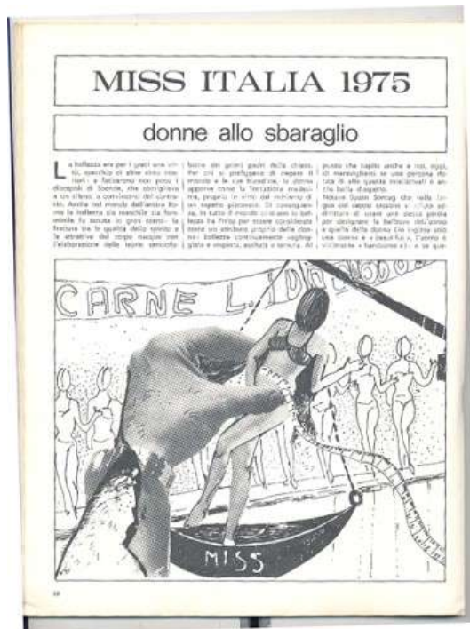
Fig. 5: Copertina di effe , III/6-7, ott-nov. 1975

Contemporaneamente la rivista, in quasi ogni numero, intraprese un'energica e sistematica pars destruens riguardo all'immagine della femminilità costruita dall'industria culturale ed egemone nei media e nel sistema dell'informazione, e passò al vaglio gli italici «miti d'oggi» 19 , in una serie di articoli efficaci fin dai titoli e dalle illustrazioni che li accompagnano; procedette così ad una corrosiva decostruzione di stereotipi e luoghi comuni. Ad esempio, nel fascicolo del maggio 1975 c'è un esilarante intervento di Grazia Francescato, “Sanremo Requiem per un festival”, che esplicita i cliché della puttana o della madonna di cui sono infarciti i versi delle canzoni in concorso; nel luglio 1975, con “Miss Italia 1975. Donne allo sbaraglio”, effe denuncia il business che ruota attorno alla mercificazione del corpo femminile nei concorsi di bellezza, ricorrendo anche ad un disegno eloquente (figura 5); con “Il nostro corpo/l'abito non fa la donna” nell'aprile del 1978 prende invece di mira il linguaggio e le proposte degli stilisti. Questi e altri contributi lucidi e graffianti decostruiscono con taglio ironico gli stereotipi di genere dell'affettività e della sessualità 20 .