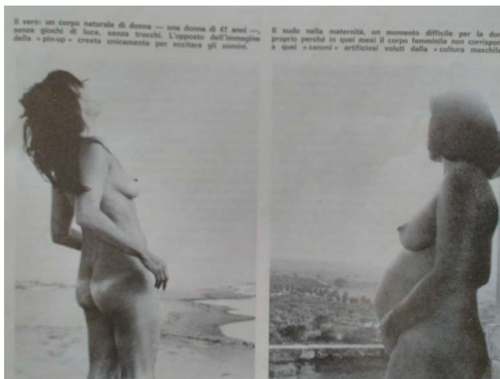
Fig. 3: fotografie di corpi «veri» di donna, effe , 1/1, 1973

nella sabbia – accompagnate dalla didascalia «il vero: un corpo naturale di donna senza trucchi, senza falsificazioni. L'opposto dell'immagine della pin-up creata unicamente per eccitare gli uomini» (figura 3); a fianco è invece riprodotta una copertina di Playboy , accompagnata dalla didascalia «il falso: un profilo di donna ritoccato». Di questa valorizzazione del “corpo naturale” Greer stessa era un'icona, anche in termini performativi e di stile comportamentale: negli anni '60 aveva posato nuda insieme a tutta la redazione del magazine australiano Oz , che presto divenne la bandiera della rivoluzione sessuale di quegli anni, gli anni della swinging London e della beat revolution , di cui Greer era indubbiamente un'esponente. Adele Cambria ricorda con affetto la presenza di Greer a Roma, nel 1973, quando fu l'ospite d'onore per l'inaugurazione della palazzina liberty dove si trovava la sede di effe , e ironizza sulla fama che l'accompagnava, quella di donna scatenata, ninfomane e imprevedibile, in una Roma dalla mentalità ancora bigotta nonostante gli anni Sessanta fossero ormai alle spalle 15 .