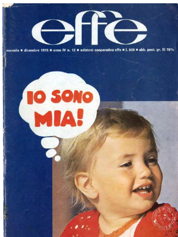
Fig. 1: Copertina di effe , IV/12, dic. 1976

rappresentazione, si intrecciano, nella nuova discorsività femminista, proprio intorno alle politiche del corpo. Lo si potrebbe dimostrare appunto anche a partire da una più ampia carrellata delle copertine di effe , che costituiscono per la rivista, come è già stato notato, una forte marca identitaria 9 : sempre lungamente discusse e collettivamente approvate, svolgono nel loro insieme un discorso visivo sul corpo che, non diversamente da quello scritto che si snoda nelle pagine interne del giornale, si ispira a un creativo principio di controinformazione. Cercherò di articolare qui di seguito la complementarità fra i due piani discorsivi, quello iconico e quello verbale, per quanto pertiene alla messa a fuoco dei discorsi sul corpo.