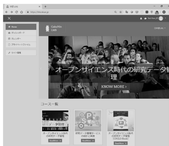
図 1 学認 LMS

標準規格に基づく教材配信機能を実装したところ、Moodle 標準の LTI プラグインでは LTI によるアプリケーション間認証に基づき、コンシューマ側からプロバイダ側に displayname , email などの個人情報が取り込まれるため、これらをフィルタリングして秘匿するカスタマイズを行った。また、学習履歴データの標準規格である xAPI[8], Caliper Analytics[9]準拠のログを高等教育機関が取得できる環境を構築することにより、LTI だけでは取得できない詳細なログを提供することを可能にした。本稿では各機能の詳細について報告を行う。