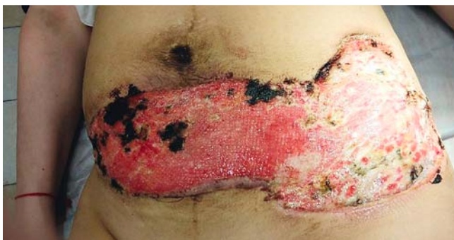
► Abb. 2 5 Wochen nach Kaiserschnitt (nach 4-facher Nekrektomie).

Tatsache, dass die Pathogenese von PG noch nicht ausreichend untersucht ist, weist die Literatur darauf hin, dass PG keine infektiöse Pathologie hat. Es wurde über die Dysregulation des angeborenen Immunsystems und die abnormale Neutrophilenfunktion bei Patienten mit PG berichtet, sodass die wichtigsten Medikamente bei der Behandlung systemische Glukokortikosteroide sind. Unter den Faktoren, die klinische Symptome von PG bewirken, unterscheidet man neutrophile Dysfunktion, genetische Mutationen und abnormale Entzündung [5]. Die klinischen Hauptvarianten der PG sind: klassische, bullöse, pustulöse, vegetierende, medikamenteninduzierte, postoperative und peristomale Variante [2, 6, 7].