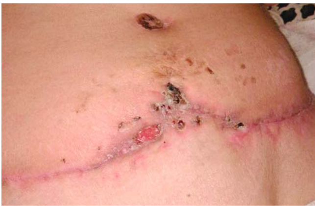
► Abb. 4 4 Monate nach Kaiserschnitt (Abdominoplastik).