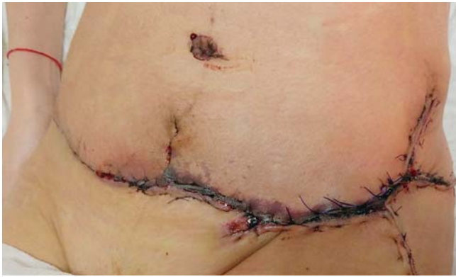
► Abb. 3 3 Monate nach Kaiserschnitt (Abdominoplastik).