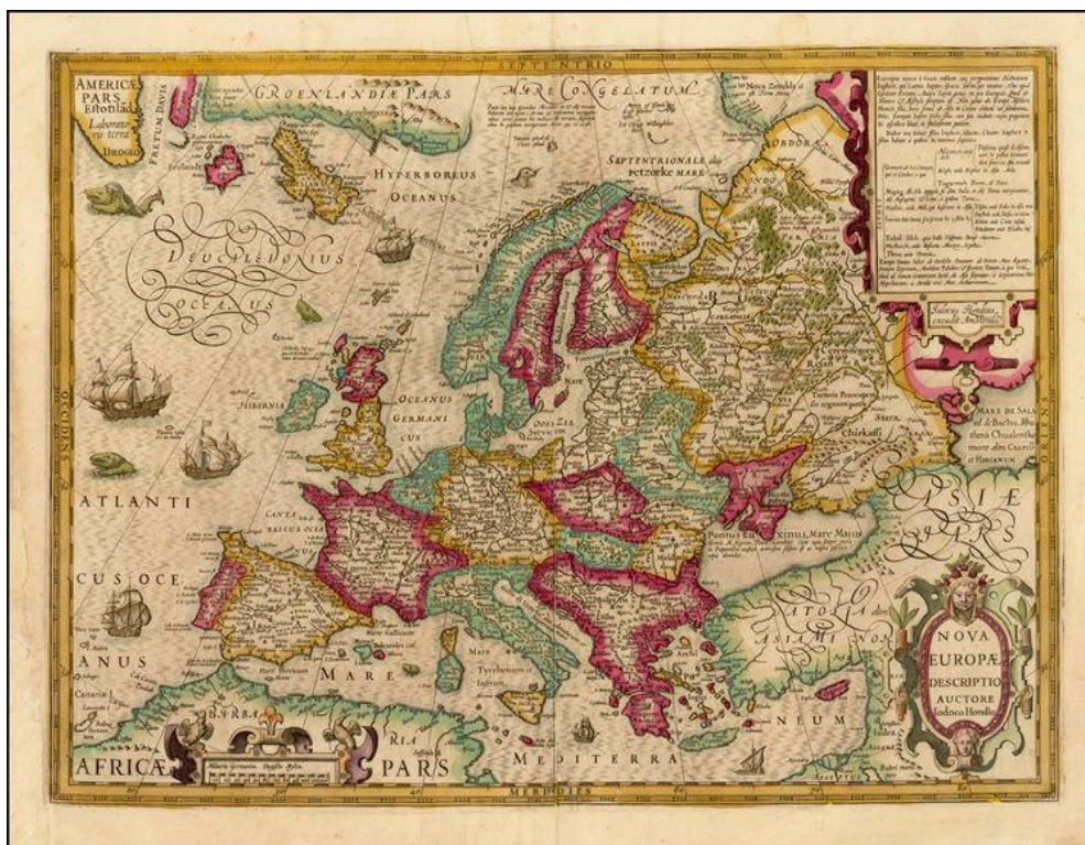
Rycina 1. Mapa Nova Europae Descriptio J. Hondiusa, początek XVII w.

gumentów” (tamże: 173) itd. Obecność tego rodzaju pustosłowania stawia pytanie o konstruktywne funkcje krytyki naukowej, gdyż dowolną pracę naukową można potraktować takimi pejoratywnymi terminami, ale chyba jednak nie wypada. W miejscu, w którym W. Wilczyński napisał, że „Mihailov ma prawo negować wyniki badań” Braudela, Brodskiego, Walickiego itp. (tamże: 171), należało oczekiwać konkretyzacji, o jakich „wynikach” i „badaniach” oraz jakimi wypowiedziami polemista je „neguje”.