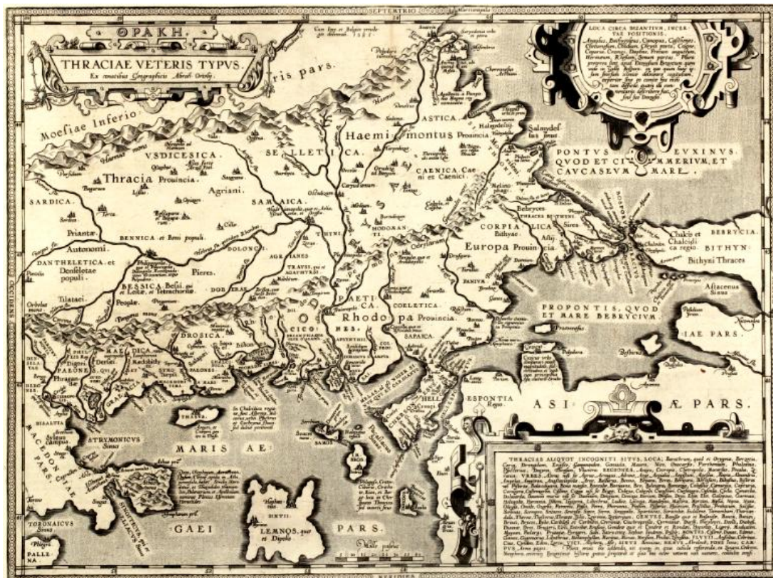
Rycina 2. Mapa antycznej Tracji Abrahama Orteliusa, 1595 r.