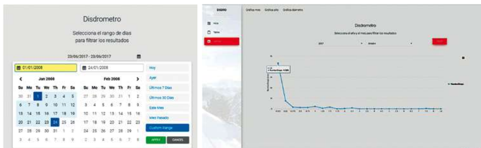
Fig 2. Interfaz de la aplicación para a) la extracción y análisis de datos por periodos concretos y b) análisis de distribuciones de tamaños de gotas en periodos de tiempo concretos.