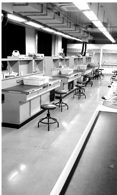
図1 筑波大学学群学生実験室

そこで、表1に示す物品を8セット購入して外付け式フード型局所排気装置を設置することを計画し、実行した。購入金額は8セットでおよそ110万円である。