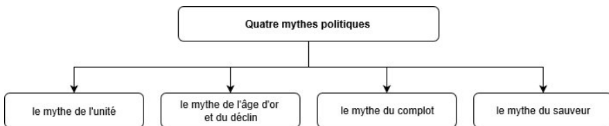
Fig. 2. Schéma des quatre mythes politiques

Nous voudrions lancer quelques pistes de réflexion sur les mythes et leur typologie dans les énoncés politiques en nous fondant sur le corpus élaboré à partir de l'allocution de Marine Le Pen à la Fête des Nations à Nice le 1 er mai 2018.