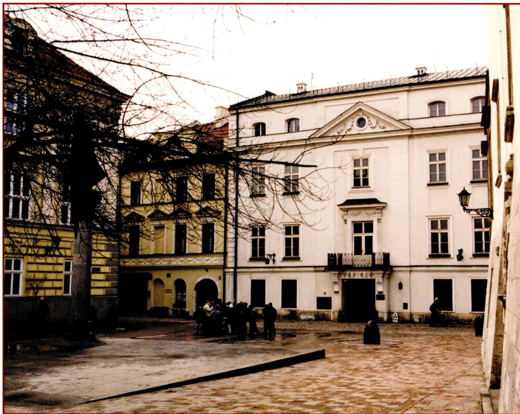
Ulica Kanonicza 9 - siedziba Rektoratu Krakowskiej Szkoły Wyższej im. Andrzeja Frycza Modrzewskiego