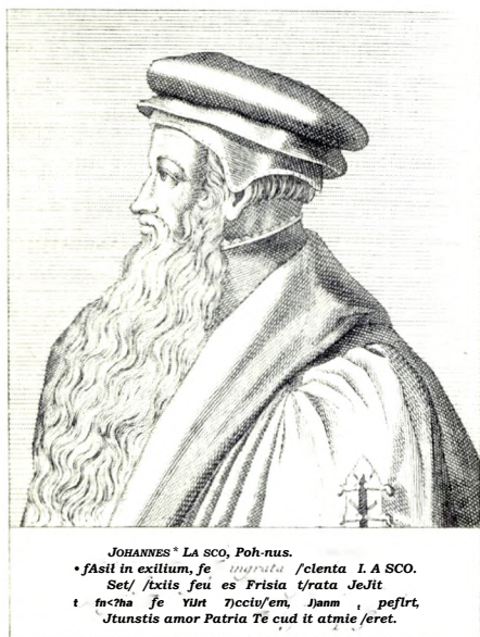
Jan Łaski mi, (1499-1560). Miedzioryt.

Dzieło Lascius... ukazało się w przededniu mającego obradować w Krakowie sejm. Zamiarem Modrzewskiego było poruszenie sumień i umysłów posłów oraz senatorów panującym w Polsce bezprawiem i nierównym traktowaniem poszczególnych grup społecznych za najcięższe zbrodnie. Występował przeciw płaceniu głów szczyzny przez szlachtę za zabójstwa. Praca została przełożona zapewne na język polski, jak na to wskazuje inwentarz sporządzony po śmierci drukarza Mikołaja Szarffenberga. Niestety, tłumaczenie nie zachowało się.