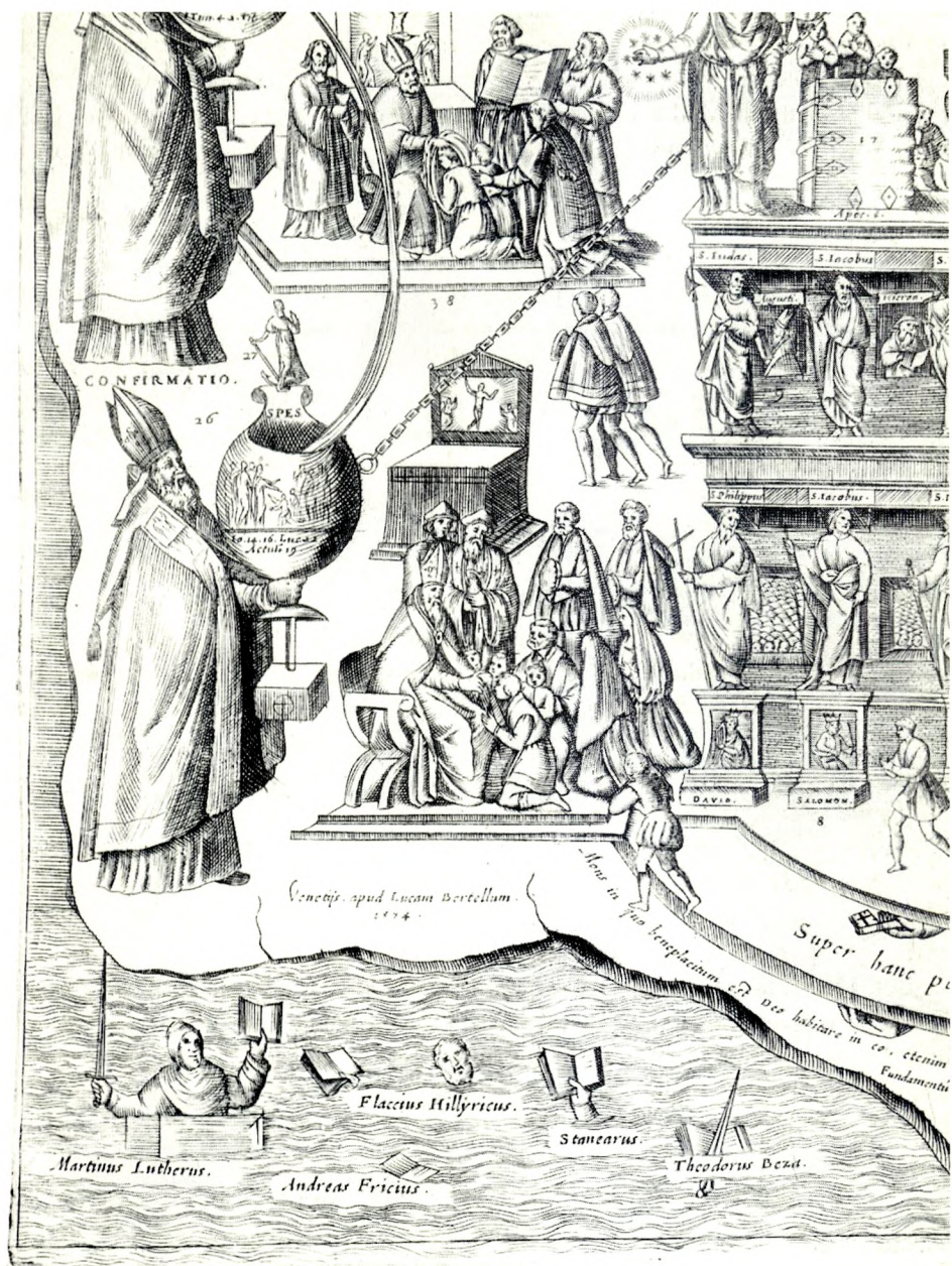
Andrzej Frycz Modrzewski w otęinach piekielnych. Miedzioryt z: Tomasz Treter, Typus ecclesiae catholicae , Roma 1581.