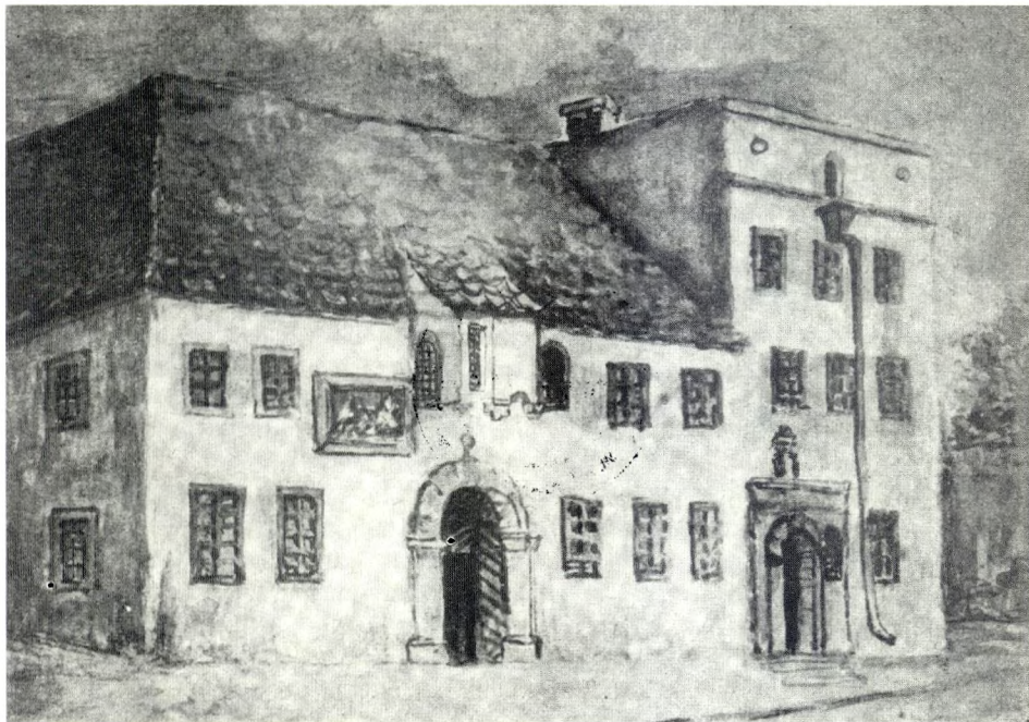
Bursa „Jeruzalem” na rogu ul. Gołęziej i Jagiellońskiej. Muzeum UJ - akwarela.

Andrzej Frycz Modrzewski (ok. 1503-1572) był najwybitniejszym polskim pisarzem politycznym XVI wieku. Pochodził ze szlacheckiej rodziny herbu Jastrzębiec. Jego ojciec Jakub był wójtem Wolborza, miasteczka należącego do dóbr biskupa kujawskiego. Frycz od najmłodszych lat kształcił się zapewne w szkółce parafialnej. W 1514 r. pobierał nauki w szkole przy kościele pod wezwaniem Bożego Ciała na Kazimierzu koło Krakowa. W latach 1517-1519 studiował w Krakowie. Wiosną 1517 r. wpisał się do albumu studentów Wydziału Sztuk Wyzwolonych Uniwersytetu Krakowskiego, płacąc 2 grosze wpisowego, jako Andreas Jacobi de Wolborz 1 . Mieszkał wówczas w Bursie Jerozolimskiej, przy ulicy Gołęziej.