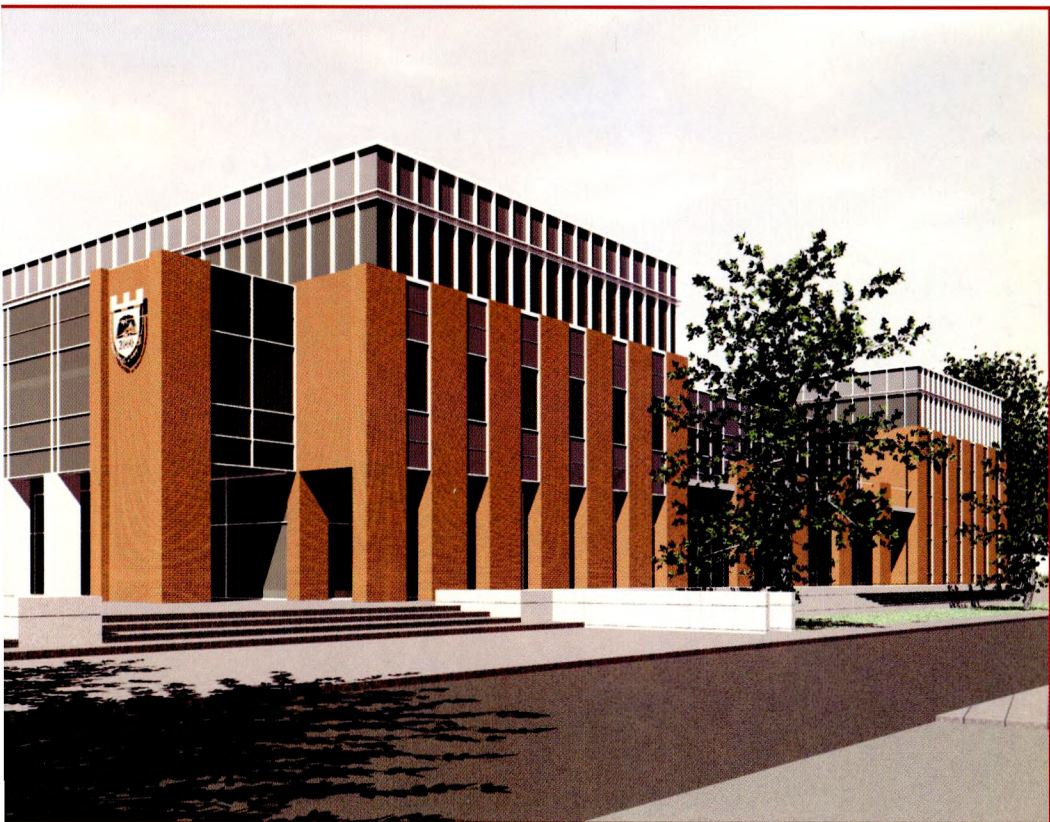
Wizualizacja Kampusu Krakowskiej Szkoły Wyższej im. Andrzeja Frycza Modrzewskiego budowanego przy ul. G. Herlinga-Grudzińskiego