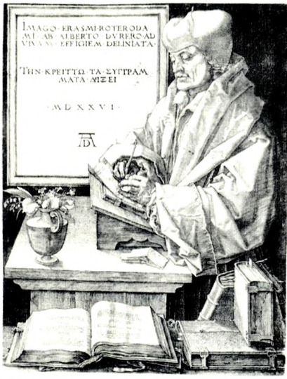
Erasm z Rotterdamu (ok. 1469-1536). Albrecht Diirer, miedzioryt.