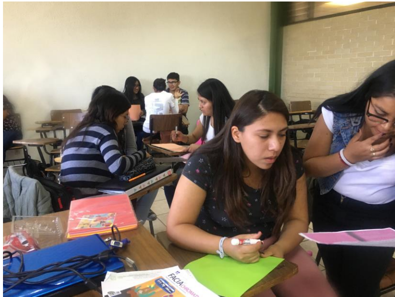
Figura 3: Lic. en Informática Administrativa, 6° semestre, turno matutino.

El Ingeniero comenta cómo se llevó a cabo esta dinámica, en primer lugar, “círculos de lectura sobre los símbolos universitarios y en segundo lugar un periódico mural de forma general con todo el grupo. En la primera actividad se realizaron pequeñas exposiciones, cada equipo eligió uno de los símbolos universitarios y lo expuso de manera particular”.