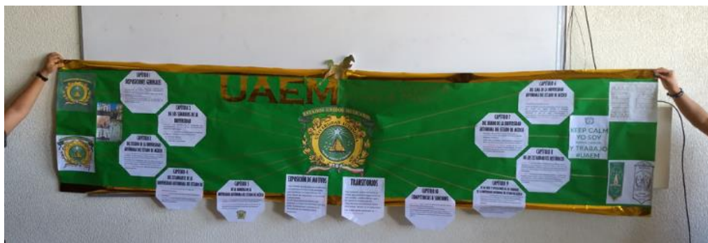
Figura 7: Resumen del Reglamento de los Símbolos Universitarios de la UAEM, Lic. en Derecho, 8° semestre, turno vespertino.

La Maestra Gómez afirma que “se llevaron a cabo las actividades de Identidad Universitaria, siendo estas el análisis y reporte de lectura con el grupo de 4° semestre, turno vespertino, de la Licenciatura en Derecho, con un promedio de 32 alumnos.