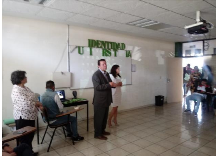
Figura 4: Lic. en Informática Administrativa, 4° semestre, turno matutino.

De forma personal considero que cada estudiante utilizó su creatividad, haciendo uso de información en donde destacaron las características más importantes.