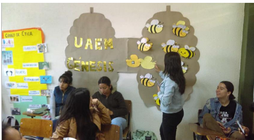
Figura 10: Génesis de la UAEM. Licenciatura en Contaduría, 4° semestre, turno matutino.