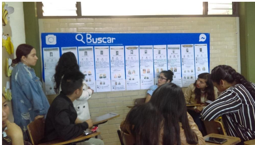
Figura 13: Personajes importantes de la UAEM. Licenciatura en Contaduría, 4° semestre, turno matutino.

En la Figura 13, se puede apreciar la exposición sobre el tema de personajes importantes en la UAEM, en donde los estudiantes utilizan un formato en línea para buscar los aspectos más relevantes aportados por cada uno.