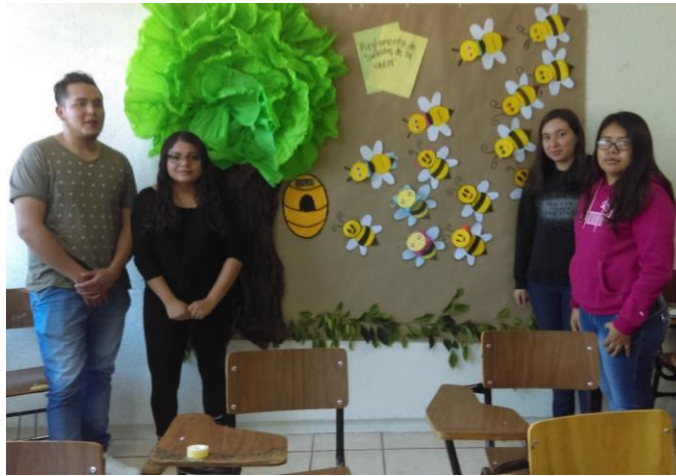
Figura 14: Reglamento de los símbolos de la UAEM. Licenciatura en Contaduría, 4° semestre.

trabajaron el tema del Reglamento de los símbolos de la UAEM, quienes expusieron cada símbolo y sus características generales, en el cartel cada abejita representaba un símbolo e incluía la información en su cabeza, se podía jalar la cabeza de la abejita y la información se desprendía como un acordeón, de esta manera la comunidad podía consultar la información relevante de cada símbolo universitario.