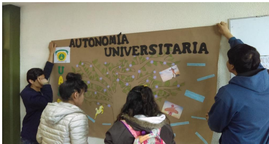
Figura 9: Licenciatura en Contaduría, 4° semestre, turno matutino.

Los equipos eligieron el tema a abordar, elaboraron su material y lo expusieron ante su grupo. Los trabajos presentados fueron sobre la Autonomía Universitaria, símbolos universitarios, código de ética, historia de la UAEM, entre otros”.