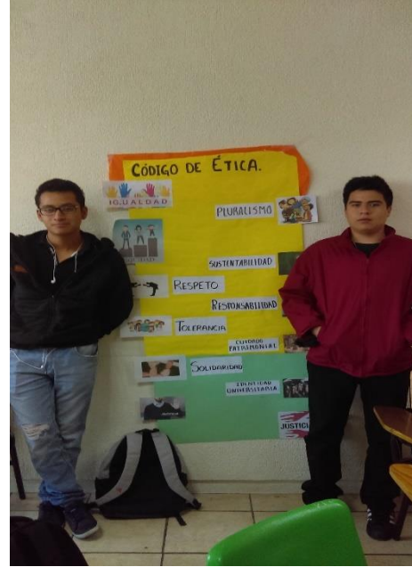
Figura 11 y 12: Código de Ética de la UAEM. Licenciatura en Contaduría, 4° semestre, turno matutino.

En la Figura 13, se puede apreciar la exposición sobre el tema de personajes importantes en la UAEM, en donde los estudiantes utilizan un formato en línea para buscar los aspectos más relevantes aportados por cada uno.