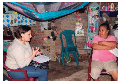
Levantamiento de información para diagnóstico socio ambiental de la comunidad el Limón, Estelí Nicaragua.