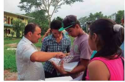
Investigaciones participativas sobre el estado actual de los recursos naturales en la zona de incidencia del proyecto.