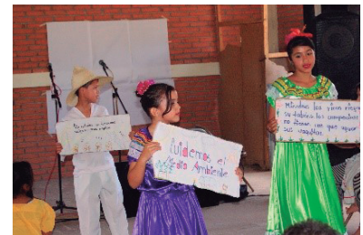
Las asesorías de expertos, la sensibilización ambiental y la inclusión de los diferentes actores, significó el éxito de la experiencia.