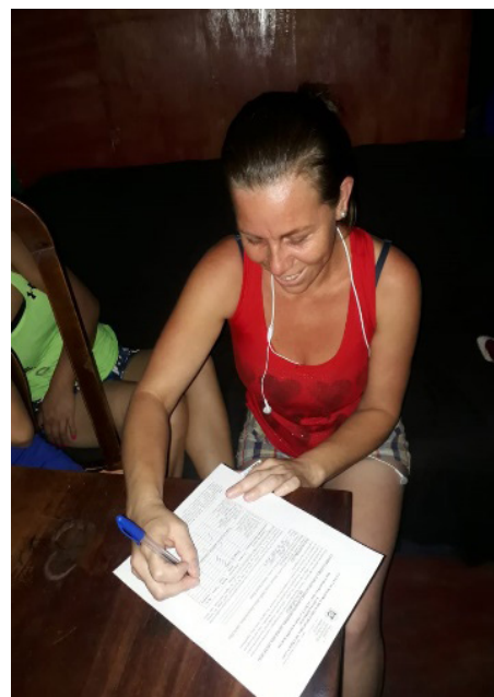
Pobladores resolviendo encuesta

Los resultados obtenidos de la encuesta indican que poco se practican los juegos tradicionales en el barrio Otoniel Arauz del municipio de Matagalpa, y que muchos de ellos no se conocen. En la tabla siguiente se expone una parte de los resultados obtenidos en 4 juegos