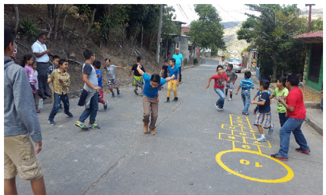
Niños y niñas participando en el juego tradicional Landa

Juego en el que una persona persigue a sus compañeros hasta tocar a uno de ellos, al suceder esto, de inmediato quien ha sido tocado empezará a perseguir a los demás (Baltodano, 2017). En la realización de este juego los participantes se tomaron la calle de extremo a extremo para correrse de quien los seguía. Se pudo observar mucho entusiasmo y motivación de los participantes durante este juego.