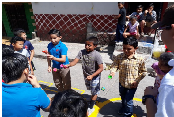
Niños del barrio Otoniel Arauz jugando con el bolero

ro, en donde se debe ensartar repetidamente una bola en la punta o base cóncava de un palo del mismo instrumento (Baltodano, 2017). Este juego inició con la modelación del mismo por parte del equipo de animadores socioculturales, luego se les pidió a los participantes que se integrase e iniciaran a competir entre sí. Se observó entusiasmo y mucha motivación en los participantes, y a la vez perseverancia, ya que se observaba dificultad para ensartar la bola en la base del palo.