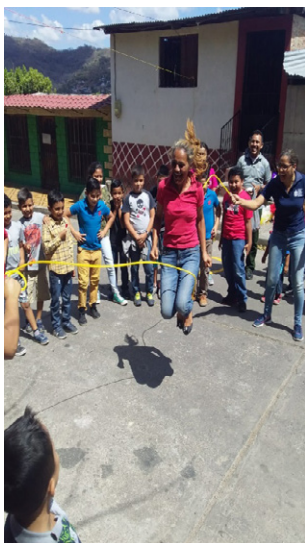
Líder del barrio Otoniel Arauz modela el juego tradicional La cuerda

Consiste en saltar una cuerda que es girada de arriba hacia abajo por dos personas en ambos extremos, las cuales aumentan la velocidad progresivamente a medida que el tiempo avanza, hasta hacer que la persona que salta toque la cuerda y quede eliminada. En este juego participaron niños, jóvenes y adultos, y se notó el entusiasmo de los participantes, por ejemplo, una de las líderes política del barrio participó en el juego y evidenció mucho dominio, el cual sirvió de inspiración para los demás.