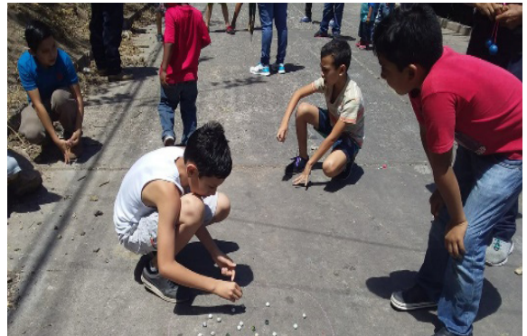
El juego tradicional de las chibolas

Juego que consiste en lanzar unas pequeñas bolas de vidrio contra otras, sin embargo, esta no es la única modalidad de juego, existen diferentes formas de jugar chibolas. Es importante mencionar que en este juego pueden participar dos o más jugadores que tengan suficientes chibolas para competir (Baltodano, 2017). Para este juego se les repartió una cantidad de diez chibolas por participantes, quienes rápidamente se organizaron y procedieron a jugar hasta quedar sin chibolas y ser eliminados.