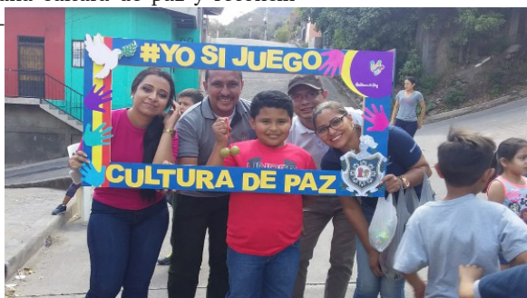
Miembros del equipo de animadores socioculturales

diante la intervención sociocultural se hicieron presente niños de diferentes familias, y también adolescente, jóvenes, adultos y adultos mayores para presenciar la puesta en práctica de estos juegos. Esto indica que los juegos tradicionales favorecen la unidad de las familias del barrio y ayuda a crear lazos fraternos y afectuosos entre los mismos.