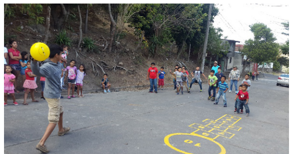
Niños del barrio Otoniel Arauz jugando el macho parado

Durante la realización del juego se observó la integración de los niños, niñas y jóvenes presentes, por lo cual, se tuvieron que organizar diferentes grupos por edades y sexo. El entusiasmo con que se entregaron los pobladores a la actividad fue más que evidente, y al finalizar la actividad se les dio estímulo a los que ganaron el juego.