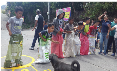
Práctica del juego tradicional los encostalados

Es un juego de carreras en donde los participantes deben saltar dentro de un costal hacia una meta determinada, y gana quien llegue de primero a la meta. Generalmente se practica en las escuelas y barrios para dar premios a los ganadores de las carreras, y lo juegan mujeres y varones (Baltodano, 2017; Asociación de Comunicación y Movilización Social “Los Cumiches”, 2009). Este juego fue muy aceptado por los pobladores del barrio en dos vías: unos participaban y otros hacían barra. El juego se efectuó por edades y por la cantidad de participante se hicieron varias rondas de carreras.