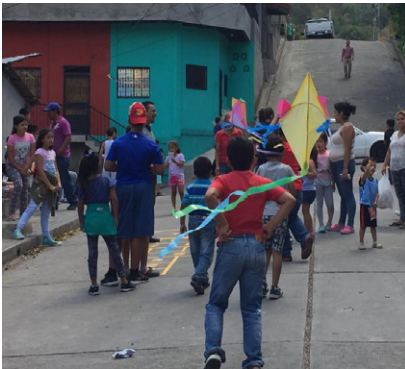
Pobladores del barrio Otoniel Arauz jugando con las cometas

El barrilete es un juego tradicional que consiste en hacer volar un artefacto llamado barrilete, cometa, pavanas o papalote, el nombre varía según el país y la cultura. Mediante este juego los niños experimentan distintas emociones y le permiten socializar e integrarse de manera grupal. En este sentido, para la realización de este juego se llevó una docena de cometas las cuales se repartieron entre los participantes. Como se puede observar, los niños hicieron volar su respectiva cometa y como premio se les obsequió una cada uno de los participantes.