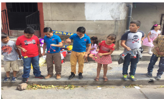
Niños del barrio Otoniel Arauz jugando traca, traca