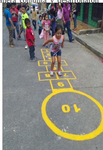
Niños y niñas del barrio Otoniel Arauz participando en la rayuela

La rayuela es un juego tradicional nicaragüense que requiere únicamente una tiza y una superficie plana para jugarlo. Este juego, por ser poco conocido, se inició con la explicación y demostración por parte del equipo de animadores socioculturales, lo cual sirvió de motivación para que los participantes se aventuraran a realizarlo. Con este juego los niños y niñas se integraron de manera conjunta y desarrollaron sus habilidades y destreza al saltar correctamente los distintos espacios de la rayuela a fin de recoger el objeto lanzado sobre la misma.