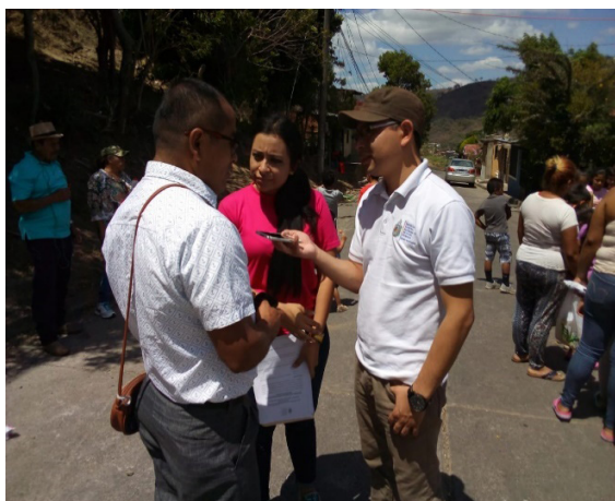
Investigadores realizando entrevistas a pobladores

• Entrevistas: Arias (2012) plantea que esta es una técnica basada en “un diálogo o conversación ‘cara a cara’, entre el entrevistador y el entrevistado acerca de un tema previamente determinado, de tal manera que el entrevistador pueda obtener la información requerida” (p.73). Esta se aplicó a niños y a líderes del barrio que participaron en la intervención sociocultural, con el propósito de conocer la valoración que estos tenían de la actividad que se llevó a cabo.