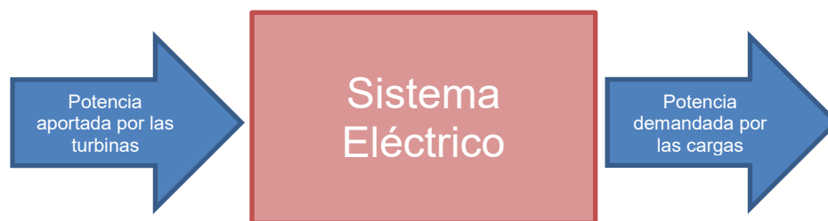
Figura 1. Balance de energía en un Sistema Eléctrico

multiplicada por el número de pares de polos es precisamente la frecuencia eléctrica del sistema. Mientras persiste el régimen permanente, el par acelerante aplicado por cada turbina sobre cada generador síncrono es igual, descontando las pérdidas, al par electromagnético que tiende a frenar la máquina. Si en un momento dado aumenta la carga, es decir la potencia eléctrica demandada en el sistema, entonces aumenta el par electromagnético en los generadores, éstos comienzan a frenarse, y la frecuencia eléctrica disminuye progresivamente”. Es necesario que la frecuencia permanezca dentro de un rango estricto para garantizar la calidad del sistema eléctrico y evitar la mala operación de equipos industriales o domésticos (Ledesma, 2008).