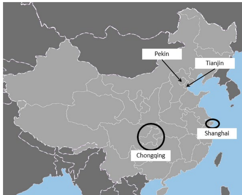
Imagen 1. Ciudades a nivel provincia: Pekín, Tianjin, Shanghái y Chongqing.