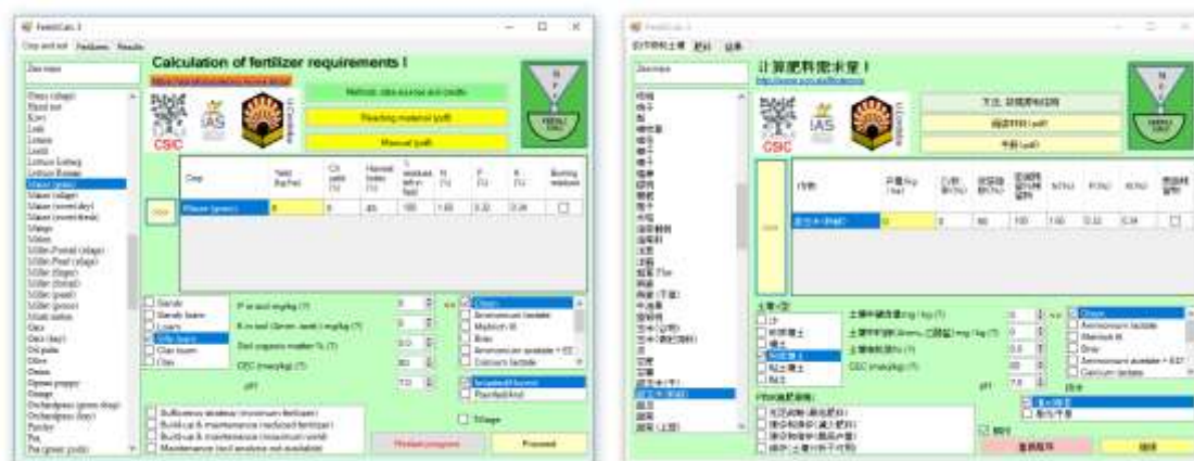
Figura 4. Interfaz de FertilCalc en las versiones inglesa y china.