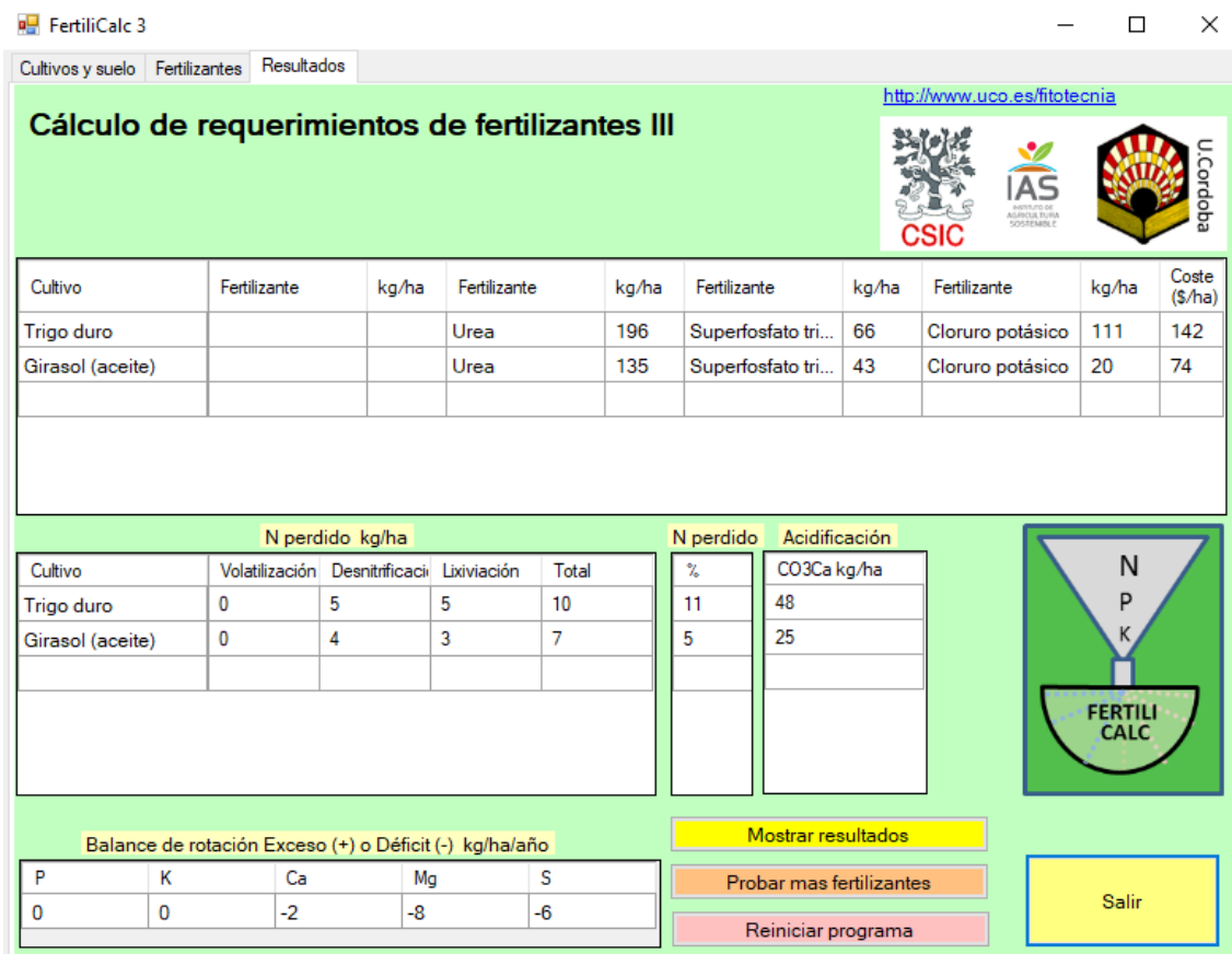
Figura 3. Formulario de resultados en la interfaz de FertilCalc.