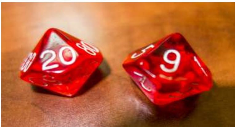
Figura 4. Dados porcentuales empleado para determinar la ocurrencia de falsos positivos/falsos negativos.

Finalizado el tiempo de que disponían para esta parte (30 minutos), algunos grupos llegaron al diagnóstico correcto y otros no. A continuación, el profesor realizaba una introducción al uso de algoritmos como herramienta de apoyo y les facilitaba los algoritmos creados para las enfermedades respiratorias y digestivas porcinas, dejando cinco minutos para usarlo. Transcurrido este tiempo, se volvían a reunir todos los grupos, se analizaba en conjunto la práctica, enfatizando en la utilidad (o no) de los algoritmos facilitados y, para finalizar, se les pasó una breve encuesta sobre qué les había parecido la práctica en general y el uso de los algoritmos en particular.