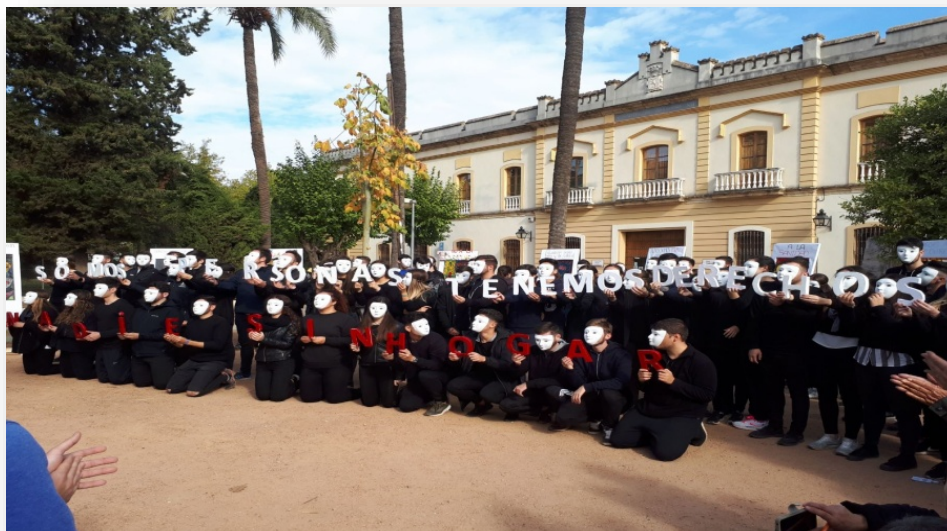
Figura 4. Representación de las Vidrieras en el Acto de sensibilización de calle. Elaboración propia.

La representación de las vidrieras fue el día 23 de noviembre, día internacional de las PSH, donde el alumnado participó en el acto organizado por la propia Cáritas Diocesana (véase figura 4).