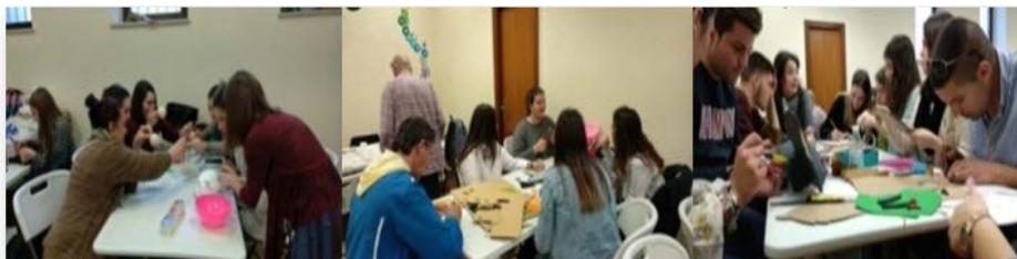
Figura 7. Grupos de trabajo cooperativo en el aula.

Por último, el alumnado elaboró de forma individual una reflexión sobre la experiencia vivida en la actividad ejecutada.