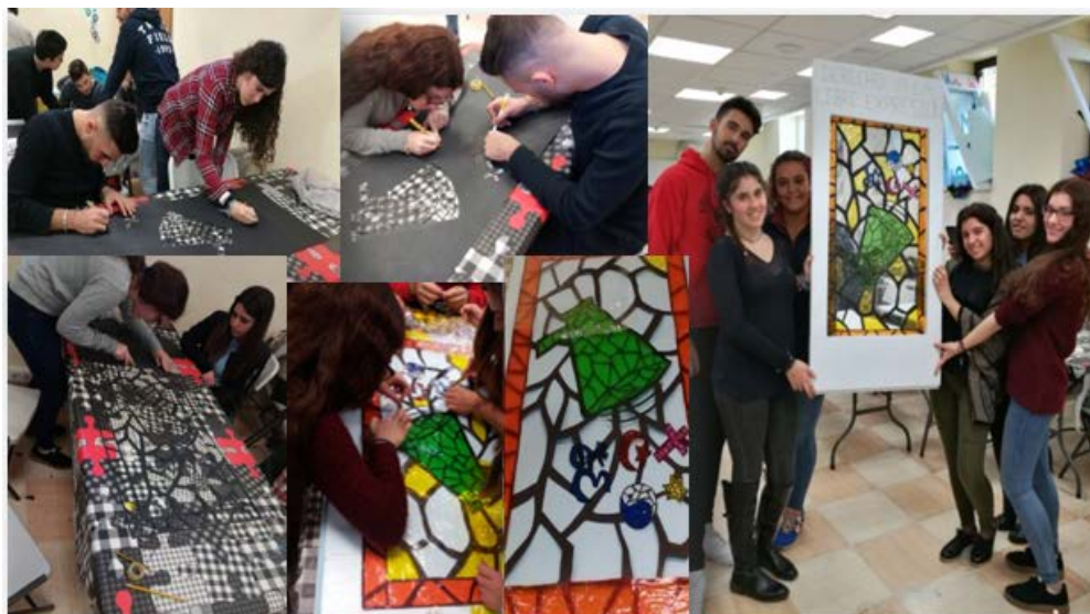
Figura 5. Proceso de elaboración de la vidriera. Elaboración propia.

En segundo lugar, con respecto al alumando de Educación Infantil, se realizó una representación teatral, en la que intervinieron las siguientes materias: Expresión Plástica Infantil y su Didáctica y Habilidades Comunicativas, Sociales, de Gestión y Emprendimiento para la Función Docente. Para ello, la selección de competencias fueron las siguientes (véase figura 6):