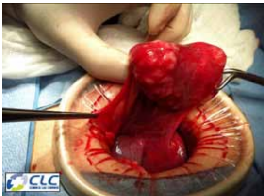
Figura 1. Trompa de Falopio derecha conteniendo un mioma de 8 centímetros en la porción media. Se aprecia la trompa alargada y se identifica la zona ístmica y ampular indemnes, a ambos extremos del mioma. El tumor contiene en su parte superior la pared de la porción media de la trompa sin lumen.

Sin embargo, existen diferentes teorías, para explicar el hallazgo de un mioma en lugares extrauterinos. Los de localización primaria podrían