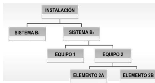
Figura 1 Niveles de análisis para evaluar criticidad.

Moreau, (2013) plantean los siguientes niveles: Instalación, Sistema, Equipo y Elemento. De acuerdo con los requerimientos