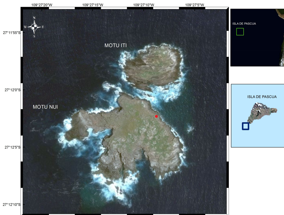
Figura 1. Posición del avistamiento de piquero café Sula leucogaster en Motu Nui, Isla de Pascua (punto rojo). Imagen: Jaime Aguilera© / Position of the sighting of Brown Booby Sula leucogaster in Motu Nui, Easter Island (red dot). Image: Jaime Aguilera©

para sintetizar y evaluar los reportes especialmente de avistamientos y estudios científicos realizados en los piqueros pantropicales.