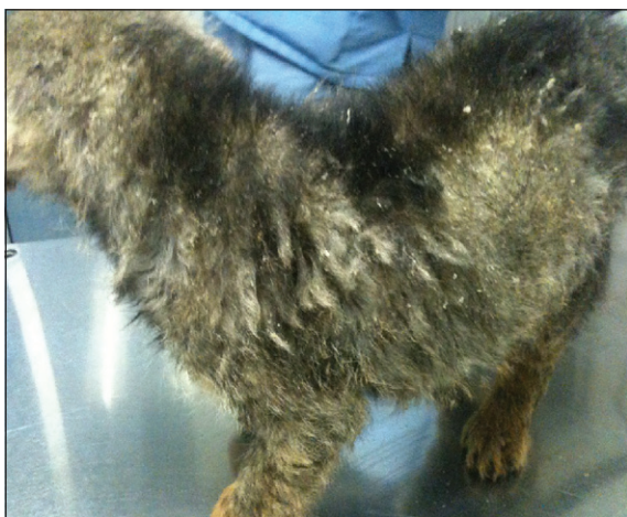
Figura 2. Descamación y alopecia del cuerpo del cachorro.