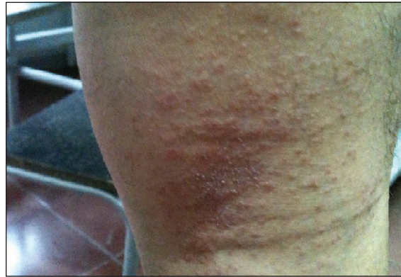
Figura 5. Lesiones papulares, costrosas y escoriaciones en el hueso poplíteo del padre.