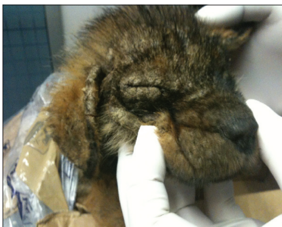
Figura 1. Descamación y alopecia de la cara y cabeza del cachorro.

Posteriormente los propietarios comunicaron que el perro falleció algunas semanas después de comenzar el tratamiento.