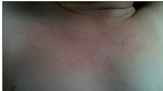
Figura 7. Lesiones papulares, costrosas y escoriaciones en el cuello de la lactante.