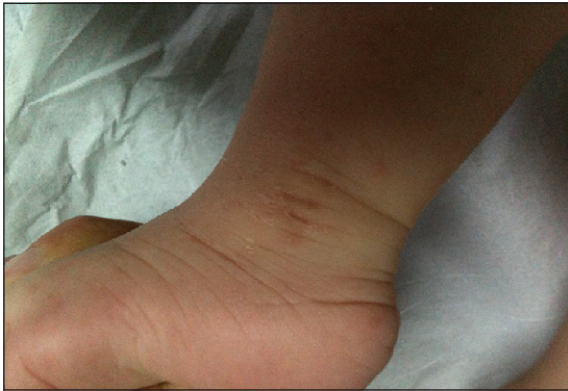
Figura 4. Lesiones papulares y costrosas en la piel de zona maleolar de la lactante.