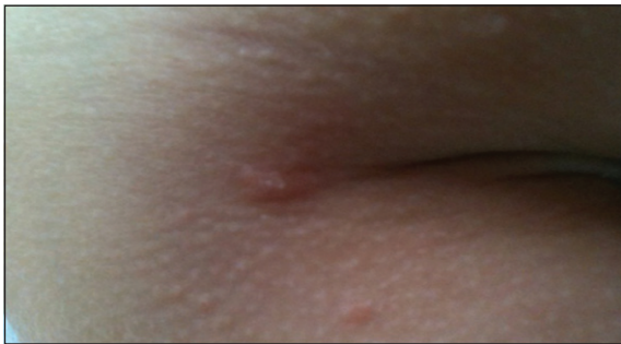
Figura 6. Lesiones papulares pruriginosas y escoriaciones en zona torácica de la niña de 7 años.