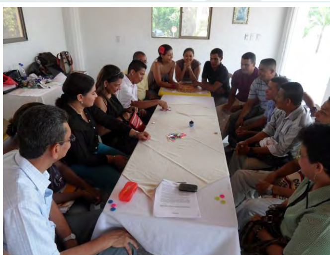
Imagen No. 2: Ejercicio de Concertación y Construcción Colectiva

Esta actividad es acompañada y facilitada por el equipo del proyecto, a fin de lograr construir colectivamente propuestas que logren generar mayor sensibilidad y reconocimiento sobre la importancia de la convivencia, la paz y la reconciliación entre todos.