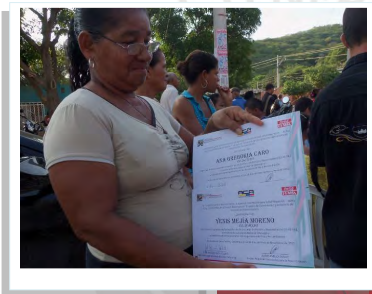
Imagen No. 4 y 5: Eventos de cierre y certificación de participantes

Este escenario también puede reflejar la intención de generar “actos simbólicos” desde iniciativas de los animadores. Podrán ser rituales de Celebración de la vida, o Rituales de memoria y restauración.