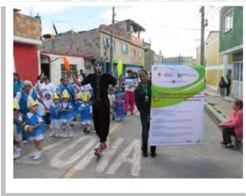
Imagen No. 3: Iniciativas de Paz – Bandas Musicales de Jardines Infantiles tocándole a la Paz