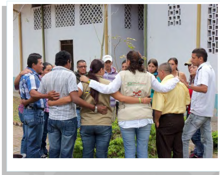
Imagen No. 1: Participantes de un proceso ESPERE

Este proceso tiene tres momentos: Perdón, Reconciliación y Transferencia Metodológica. Con los participantes se realiza la concertación de los tiempos.