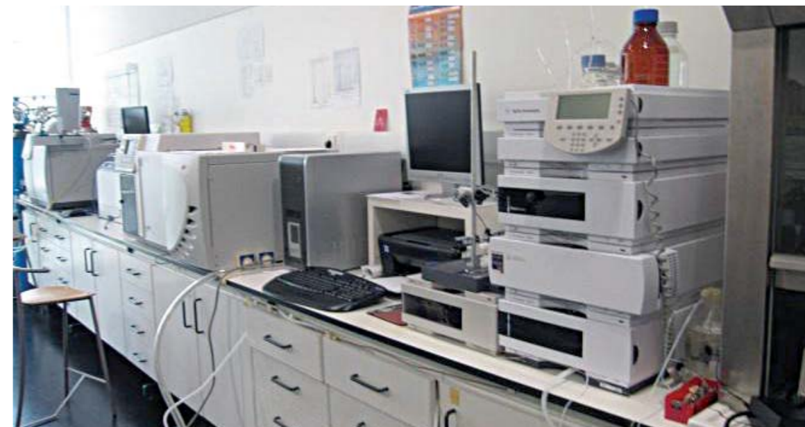
Figura 2: Laboratório de Tecnologia Alimentar da Universidade dos Açores

Na/K equilibrada ou o mais baixa possível é importante para prevenir doenças cardiovasculares. Do mesmo modo, uma razão Ca/Mg equilibrada assegura o correto funcionamento do músculo cardíaco. As macroalgas estudadas são também uma excelente fonte de ácidos gordos essenciais, nomeadamente ómega 3 ( \omega 3 ) e ómega 6 ( \omega 6 ) e possuem uma razão adequada em ácidos gordos hipocolesterolémicos/hipercolesterolémicos.