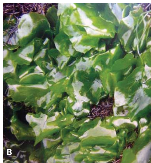
Figura 1: Macroalgas marinhas dos Açores A) Fucus spiralis ; B) Ulva rigida