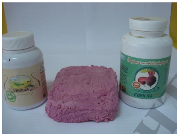
Рис. 1. Кріопорошок «Буряк»

Для досліджень використовували уніфіковану біодобавку – кріопорошок «Буряк» (рис. 1). Рецептuru сирних мас перераховували для промислового виробництва на 1000 кг готового продукту без врахування втрат.