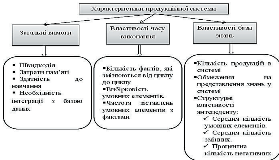
Рис. 1. Характеристики продукційної системи

умовний елемент, який характеризується тим, що узгоджується з якомога меншою кількістю фактів робочої пам'яті та породжує якомога більшу кількість зв'язувань змінних, які обмежують інші умовні елементи [18].