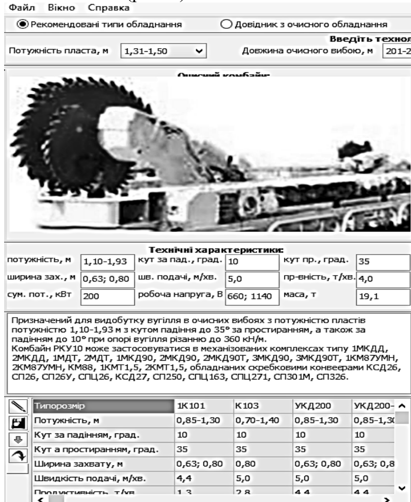
Рисунок 4 – Вікно програми, яка дозволяє оптимізувати параметри експлуатації та обирати обладнання

Тоді, суть процесу оптимізації полягає у знаходженні найкоротшого маршруту у вихідному графі g_1 вибору альтернатив, при цьому маршрут повинен проходити через кожну на рівні технологічних параметрів, обладнання, вихідних ресурсів. На основі проведених досліджень [17, 18] із обґрунтування області раціональної експлуатації було розроблено методика вибору очисного обладнання на основі теорії графів [19], а для впровадження у виробництво створено відповідне програмне забезпечення (рис. 4).