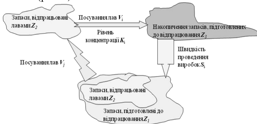
Рисунок 1 – Схема руху запасів при змінних швидкостях посування лав

У якості основних параметрів, що характеризують стійкість досліджуваної технологічної системи, розглядаються параметри інцидентів, тобто наявність запасів вугілля різного ступеню готовності до вилучення на даний відрізок планування розвитку гірничих робіт. До них належать: K_1 – параметр пропорційності, що показує, протягом якого часу можуть вестися очисні роботи при визначеній їх інтенсивності тільки за рахунок запасів, підготовлених прохідницькими ділянками в розглянутий момент часу t ; K_2 – параметр пропорційності, що показує, протягом якого часу можуть вестися прохідницькі роботи із середнім темпом тільки за рахунок розкритих запасів у розглянутий момент часу t ; K_3 – параметр пропорційності, що показує, протягом якого часу можуть вестися прохідницькі роботи із середнім темпом за рахунок запасів, що прирізають, або перерозподілені між шахтами (рис. 1).