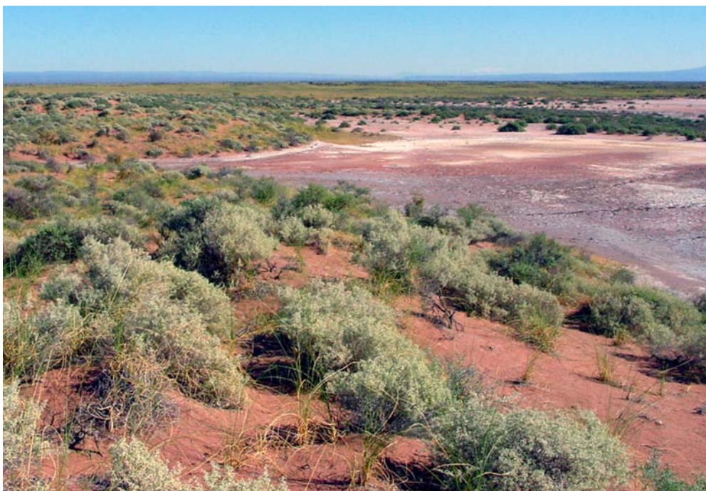
Fig. 2. Vista del Salar de Añelo, Provincia de Neuquén.