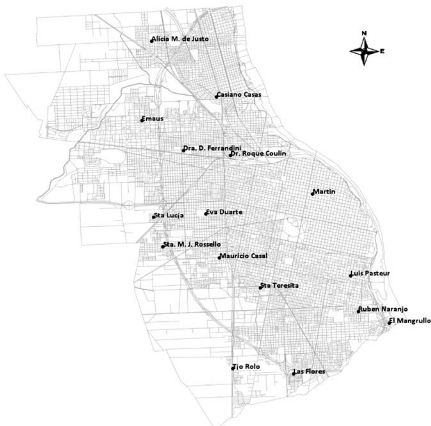
FIGURA 1. Localización de los centros de atención primaria de la salud de la ciudad de Rosario que participaron del estudio (n= 16)

Se desarrolló una entrevista de trece preguntas cuyas dimensiones se definieron sobre la base de los resultados principales de un estudio local. 6 Los ejes de indagación incluyeron lo siguiente: 1) la evaluación del problema de la anemia e identificación de los grupos de mayor riesgo, 2) el nivel de heterogeneidad de la práctica clínica en relación con el diagnóstico, prevención y tratamiento de la anemia ferropénica y 3) las representaciones acerca del suplemento con hierro por vía oral y la adherencia materna (véase el Anexo 1 en formato electrónico). La noción de representación fue definida como las informaciones, opiniones y actitudes a propósito de un objeto determinado que contribúan a la construcción de una realidad común a un conjunto social. 10