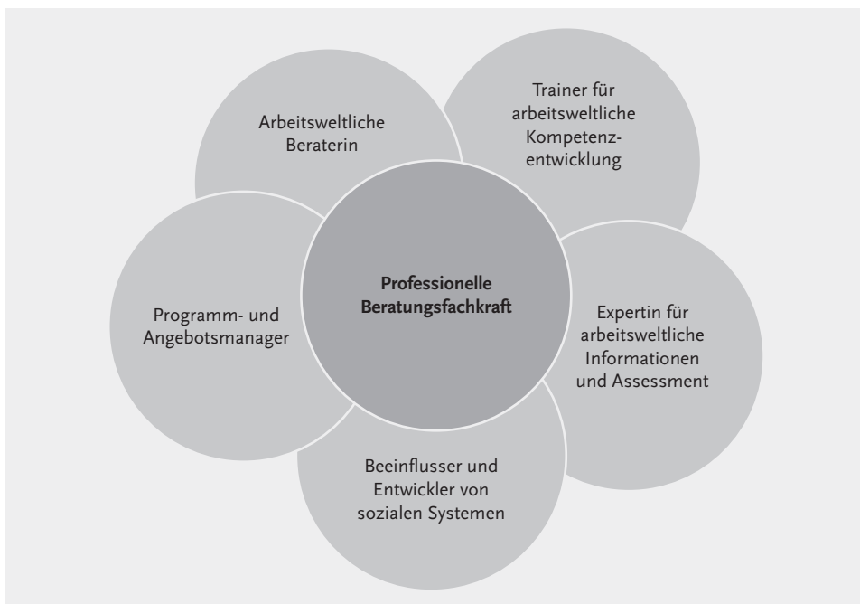
Abb. 2: Differenzierung verschiedener Kompetenzbereiche entlang der identifizierten Berufsrollen professioneller Beraterinnen (NICE 2014, S. 48)

Die im Folgenden vorgestellten fünf Berufsrollen (engl. professional tasks ) sind die Grundlage für die Differenzierung der EKS (s. Kap. 3.2). Zusammen stellen diese Berufsrollen idealtypisch die Aufgaben dar, die professionelle Berater, aber auch andere mit Beratung befasste Professionals in unterschiedlicher Abstufung ausgestalten müssen. Im Mittelpunkt der Rollen, gleichsam als Kern, steht die Professionalität der Beraterinnen. Um den Beruf des Beraters voll auszuüben, sollten alle arbeitsweltlichen Berater jede der Rollen in einem größeren oder geringeren Ausmaß umsetzen können und sie alle als Teil ihrer beruflichen Identität betrachten.