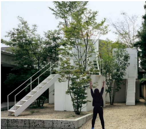
Fig 6. Sou Fujimoto. La Casa antes de la casa. 2007-2008

Otro ejemplo es la Casa antes de la casa (Figura 6), una nebulosa dentro de la ciudad formada por una agregación de elementos que configuran un paisaje urbano. Esta casa, que formó parte del proyecto Sumika, en el que se encargó a cuatro arquitectos diseñar un prototipo de vivienda con "un estilo de vida primitivo", fue construida en 2010 en el barrio de Utsunomiya en la prefectura de Tochigi. En él, Fujimoto propone una vivienda a modo de folie , formada por la adición contingente de diez cubos de chapa de acero blanca de entre 2 y 2,5 metros de lado, apilados unos sobre otros y conectados por escaleras. Esta topografía artificial crea la base de un paisaje vegetal formado por árboles que se desarrollan en las cubiertas de los cubos. Fujimoto (2008) describe el proyecto como " un lugar que es al tiempo casa, ciudad y bosque. " (p.108). En los cubos hay dormitorios, estudio, baño, cocina, etcétera, y algunos que se utilizan como recinto para plantas. Un ámbito, medio natural, medio artificial, en el que se tiene la sensación de moverse por las ramas de unos árboles que hubieran invadido la arquitectura.