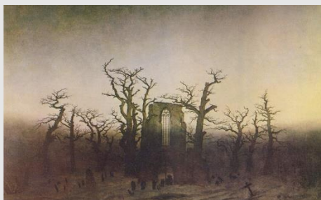
Fig. 1. C.D. Friedrich. Abadía en el robleal. 1809

En la cultura occidental, el concepto de Zeitgeist dominó las aspiraciones de universalidad de las obras artísticas. Cuestionado el modelo del Clasicismo, cada época debía de encontrar la verdad de sus producciones de acuerdo a sus aspiraciones culturales y sociales. Una verdad relativa ante el paso del tiempo que daba lugar a la transformación del pensamiento artístico y a la obsolescencia futura de cada una de las verdades encontradas. Para el pensamiento ilustrado y luego el Romántico, la ruina aparece como símbolo de la fugacidad, es el testimonio del impulso creativo del hombre pero también la huella de la subordinación a la cadena de mortalidad.