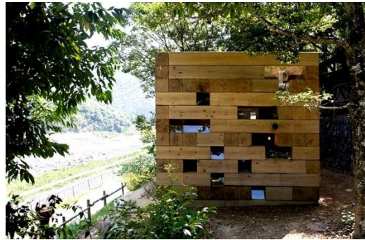
Fig. 4. Sou Fujimoto. Casa de madera definitiva. 2006-2008

la ciudad. Fujimoto quiere devolver a la gente la cabaña primitiva mediante un espacio similar a una cueva, sin mobiliario, escaleras ni suelos. Los ocupantes de la cueva se adaptan a ella, descubriendo capacidades múltiples de su utilización.