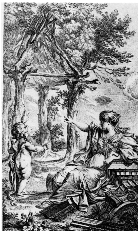
Fig. 2. Laugier. La Cabaña Primitiva. 1755

La mirada Ilustrada y Romántica hacia la relación entre la arquitectura y la naturaleza trató de evidenciar la temporalidad de las obras humanas, y sin embargo sirvió para reflexionar sobre la necesidad de su coexistencia, ya que el sentimiento de la naturaleza solo se nos abre a través del arte. Pero también el sentimiento de la ruina como retorno a lo natural llevaría a la cuestión de los orígenes, al instante en el que arquitectura y naturaleza formaban un mismo escenario a la búsqueda de una belleza natural. Rykwert en los años 70 estudió en profundidad el tema de la Cabaña Primitiva en su obra La casa de Adán en el Paraíso (1974), cuestión que a partir de Vitrubio fascino a los teóricos de la arquitectura desde Laugier a Semper y Viollet-Le Duc.