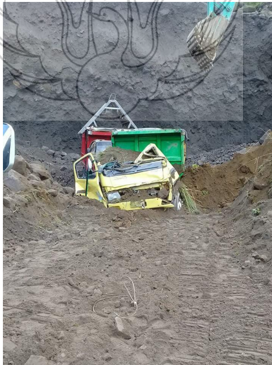
Bencana Alam berupa tanah longsor akibat penambangan yang tidak memperhatikan kondisi fisik merapi dan cenderung berlebihan