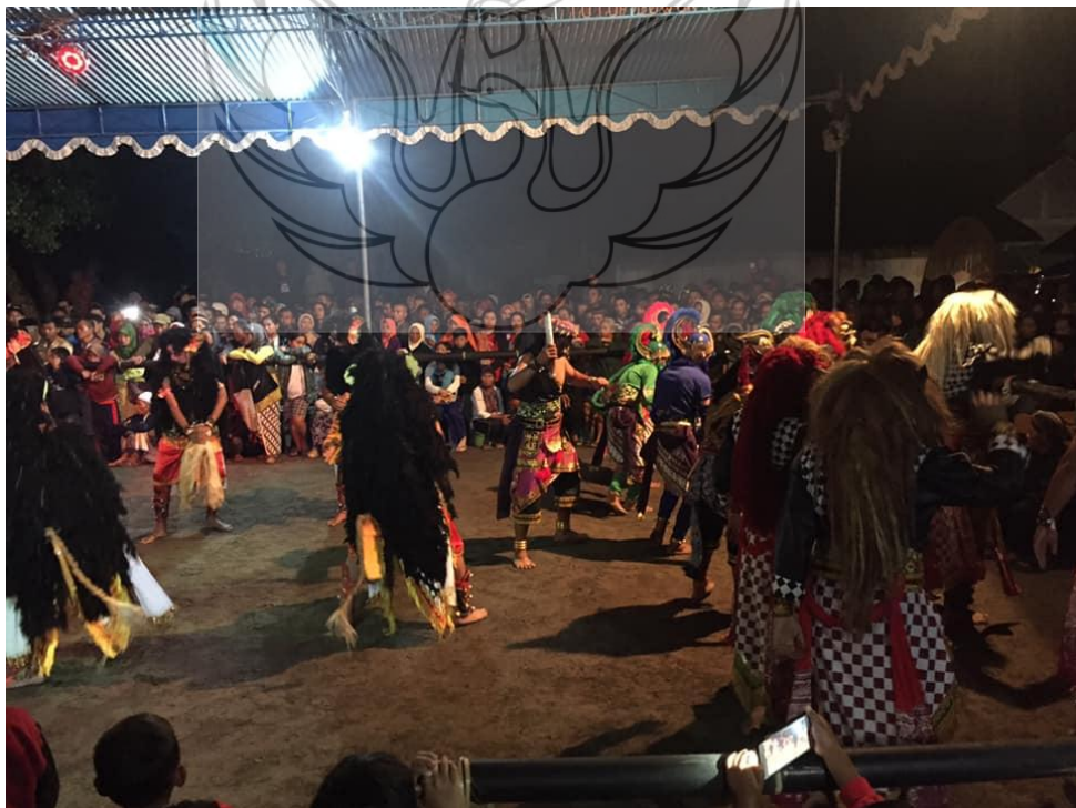
Pada hari setelah upacara sedekah Buangan , akan dilanjutkan dengan kegiatan kesenian lokal selama 2 hari.