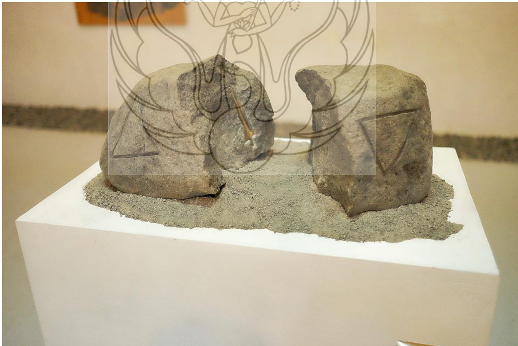
Pameran hasil karya penulis di Galeri Pascasarjana ISI Yogyakarta