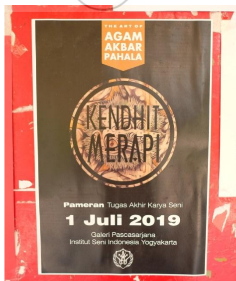
Spanduk (atas), katalog (tengah), poster (bawah)