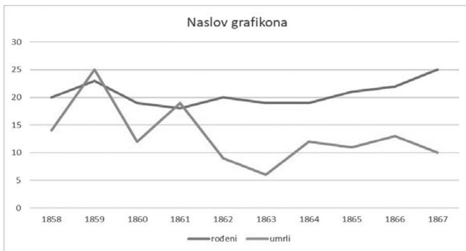
Slika 5: Odnos nataliteta-mortaliteta u Klanjecu od 1858. do 1867. 44

U drugoj polovici 19. st. dogodila se demografska ekspanzija kao i u cijeloj Europi. Bio je to temelj tzv. demografske tranzicije, tj. prelaska s demografskog ritma iz starog režima (veliki natalitet i veliki mortalitet) u modernije doba kada se smanjuje mortalitet što se odrazilo i na Klanjec.