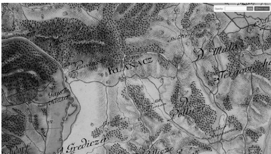
Slika 1: Prva vojna izmjera (1763-1787) 27

Vojne izmjere i katastarske karte značajan su izvor za proučavanje rasta i razvoja mjesta. Zbog krupnog mjerila zemljovida one su odlična podloga za vrlo detaljne analize urbanističke strukture naselja. Zemljovidi obiluju i toponomastičkim sadržajima, pa su koristan izvor i podloga za najrazličitija istraživanja toponomastičara i onomastičara. Prva vojna izmjera Klanjec bilježi gotovo shematski, samo kao mjesto gdje se nalazi samostan s crkvom te jedan objekt. Nema govora o bilo kakvom drugom obliku naselja dok istovremeno označava naselje Pavunci, zapadno od klanječke akropole, u neposrednoj blizini obale Sutle. Isto tako, i neka susjedna mjesta, poput npr. Kumrovca i Brezja na zapadu su značajno bolje dokumentirana. Nameće se pitanje razloga takvog nepreciznog bilježenja Klanjca budući da mnogi drugi izvori jasno i nedvosmisleno govore o postojanju naselja u drugoj polovici 18. stoljeća. 26