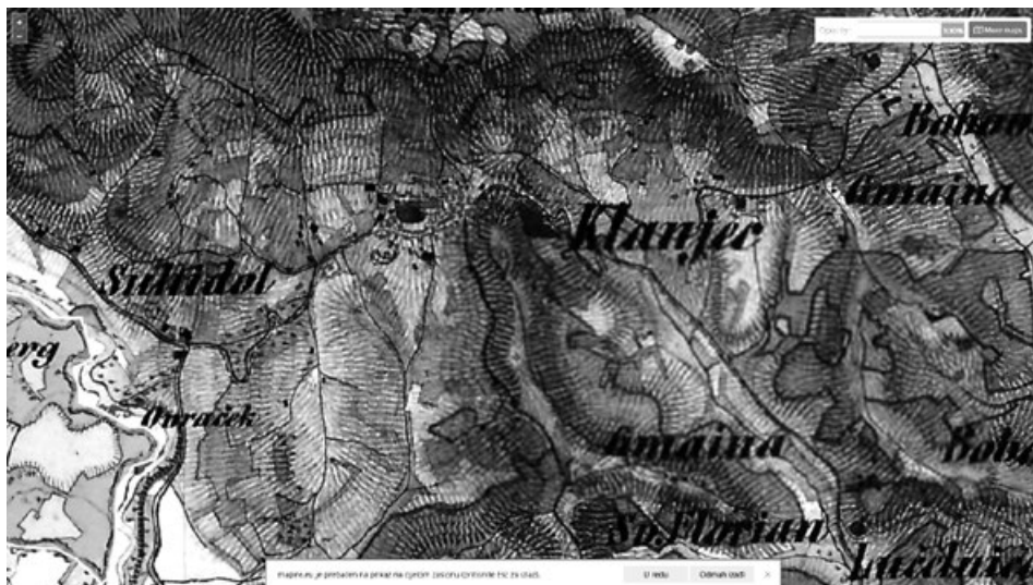
Slika 2: Druga vojna izmjera (1806-1869) 31

Za razliku od Prve vojne izmjere, Druga (1806-1869) je vrlo precizna i detaljna. Klanjec očitavamo kao aglomeraciju kružno položenu oko središta – samostana s crkvom i pripadajućim dvorištem. Simboličkim prikazom poštanske trube naglašeno je da mjesto ima poštanski ured, a na jugozapadnoj padini naznačeno je mjesno groblje (na tzv. Milčičevoj livadi). 29 I dalje ostaje naselje Pavunci uz Sutlu, ali se sada javlja i nova grupacija objekata u Suhom Dolu. 30