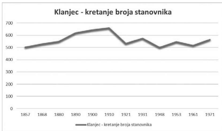
Slika 4: Klanjec – broj stanovnika od 1857. do 1971. godine 43

Pri prvom popisu stanovništva 1857. Klanjec broji 501 stanovnika i taj broj će nastaviti rasti do 1910. kada iznosi 658. Očito da se radi o razdoblju najveće ekspanzije nakon koje je uslijedio pad 1921. uzrokovan prvenstveno ratnim zbivanjima, a potom i ekonomskom krizom. U sljedećim desetljećima broj stanovnika ustalit će se na polovici šeste stotice.