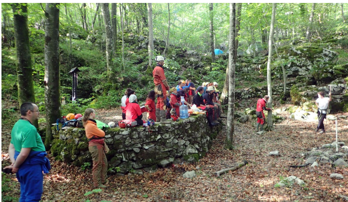
Kalibracija DistoX-a ispred ulaza u Šparožnu pećinu.