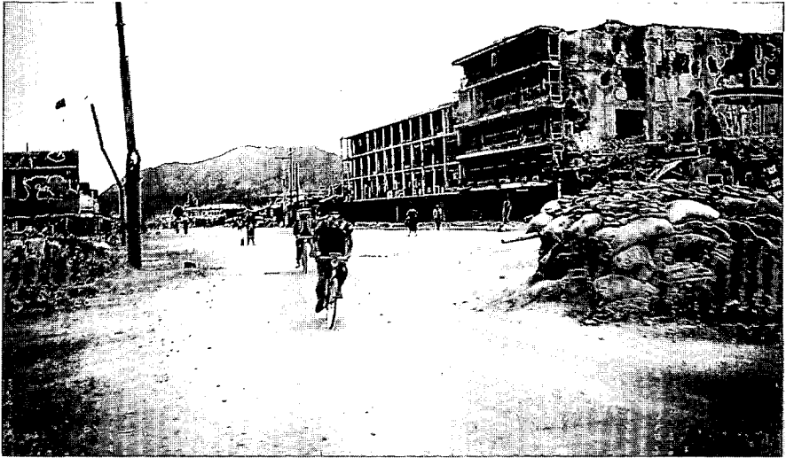
戦乱で荒廃するカーブル市内