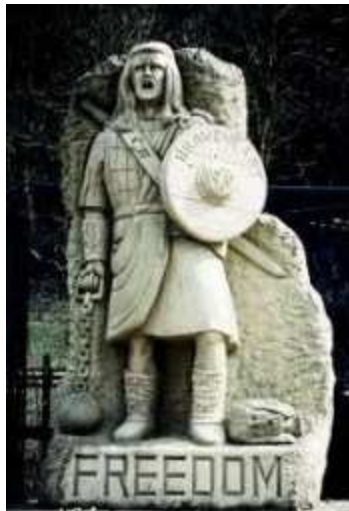
Estatua de Wallace inspirada en la película colocada junto al monumento a Wallace en Stirling en 1997.

ejército de Wallace contra los ingleses en la batalla de Stirling Bridge. Una nueva estatua de Wallace que se erigió en 1997 junto al monumento que ya existía en ese lugar tiene un parecido notable, en cuanto a ropa, cabello y rasgos físicos, con el aspecto que ofrece el actor Mel Gibson caracterizado como Wallace. Es más, en el escudo que lleva se lee la palabra “Braveheart”, y en el pedestal de la estatua está tallada la palabra “Freedom” (libertad), que es el grito que, en la película, profiere Wallace justo antes de morir bajo el hacha del verdugo en Inglaterra.