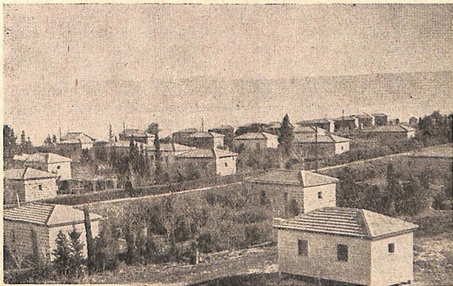
Jedno novo poljoprivredno naselje

Prvi decenij države Izrael nadovezuje se na sedam decenija pokreta obnove u Dijaspori i jevrejske kolonizacije u Palestini koji su prethodili obrazovanju države i koji su je pripremili i omogu-