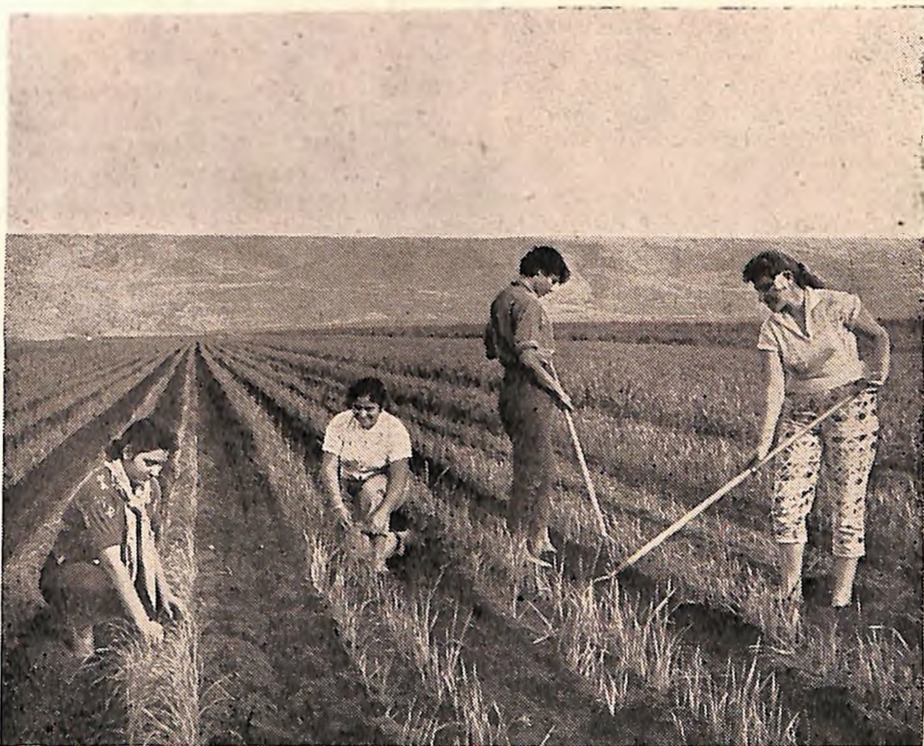
Omladina na poljoprivrednim radovima

I biva čudo u čudu, upravo dva čuda u osnovnom čudu.