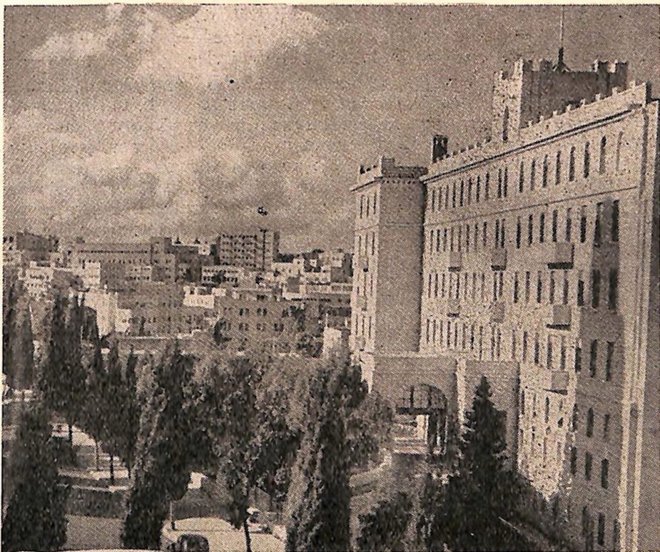
Moderni deo Jerusalima

balkanskih naroda, ona označuje i nov period u historiji Bliskog Istoka, arapskih naroda, pa i Jevrejstva. Te godine polaže se temelj Petah Tikvi, prvoj zemljoradničkoj koloniji u Palestini, kojom počinje historija novog jišuva. Jevrejski nacionalni pokret i jevrejski socijalistički pokret počinju da zahvataju jevrejske mase na sjeveroistoku Evrope. Analiza jevrejske situacije u svijetu, na prelomu stoljeća, dovodi do spoznaje da u Dijaspori ne može da bude jevrejskog života, jer se promijenila struktura svijeta, a time je nestalo društvene baze na kojoj se održavala i razvijala jevrejska narodno-vjerska zajednica. U rasulu prijeti Jevrejima fizička opasnost, eko-