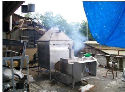
Gambar 4 Alat penukar kalor plat datar diletakkan di atas tungku pembakaran pada mesin pengering RDF

Hal ini perlu dilakukan untuk mengetahui besarnya masa jenis, konduktivitas thermal, kalor spesifik, viskositas dinamik dan bilangan prandtl dari masing-masing fluida yang sedang mengalir melalui alat penukar kalor.