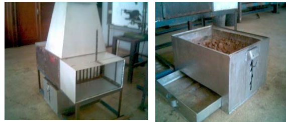
Gambar 1 Alat penukar kalor dan tungku pembakaran

Penelitian ini menggunakan alat penukar kalor plat datar dan tungku pembakaran yang terbuat dari bahan aluminium. Bentuk tungku pembakaran bahan bakar batubara disesuaikan dengan bentuk alat penukar kalor plat datar yang digunakan, sedangkan dimensi tungku pembakaran disesuaikan dengan jumlah bahan bakar yang akan digunakan, sebagaimana Gambar berikut.