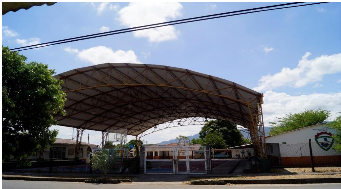
Ilustración 4 Instituto Diversificado Monterrey. Sede El Olímpico

donde se aplica la metodología de aprendizajes significativos, cuenta en el momento con 7 docentes y aproximadamente 160 estudiantes de pre-escolar a quinto de primaria. Los docentes en su mayoría son nombrados en propiedad mediante el decreto 2277. Los niños, hijos de los habitantes del barrio provenientes de familias disgregadas demuestran poco interés por las actividades inter- y extra escolares, situaciones que dificultan la labor educativa, dando como resultado bajo rendimiento académico.