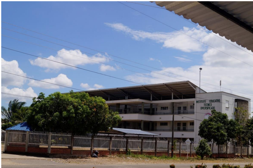
Ilustración 3 Foto Instituto Educativo Técnico Diversificado, Sede central