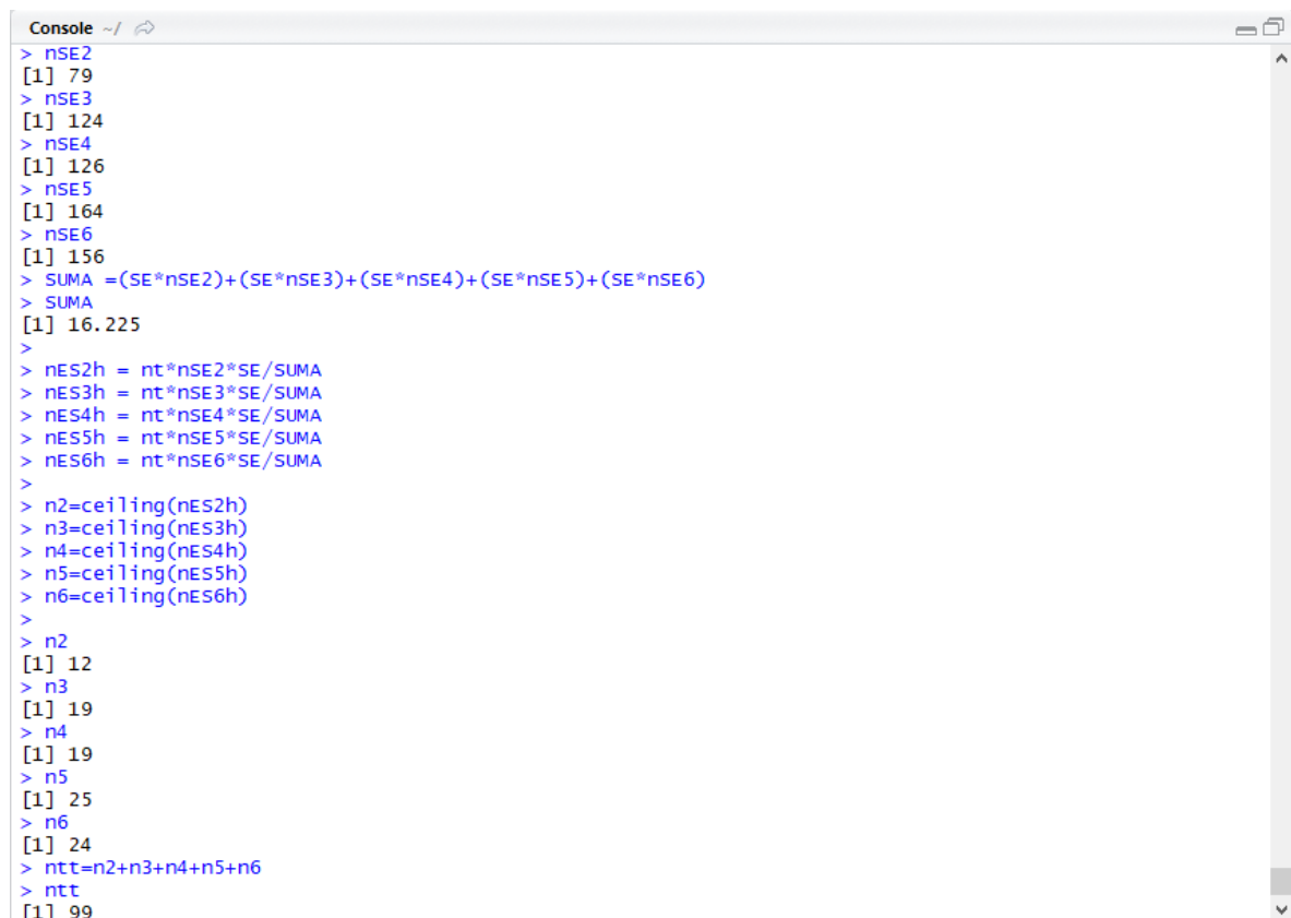
Figura 3.5: R Studio Apéndice B

Tamaño de la muestra por estratos n_2= 12 , n_3=19 , n_4= 19 , n_5= 25 , n_6=24