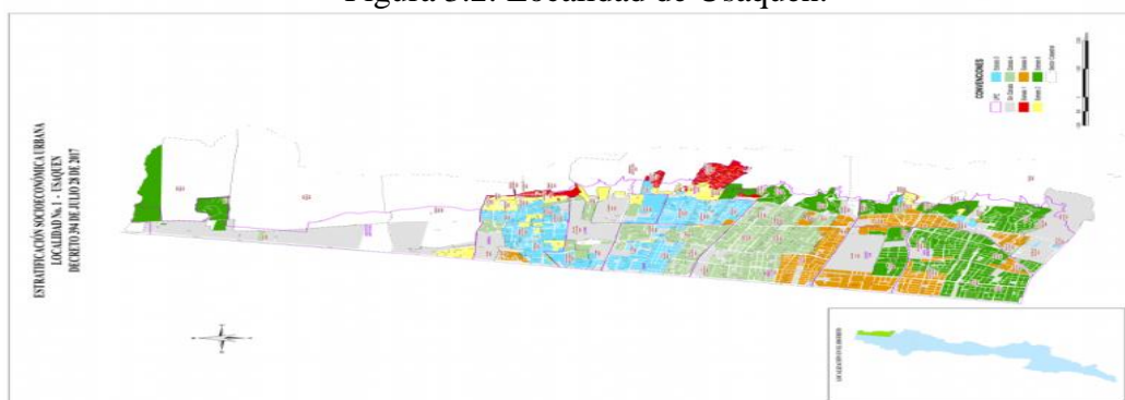
Figura 3.2: Localidad de Usaquén.

La cobertura del estudio es la zona de Usaquén mostrada por estratos.