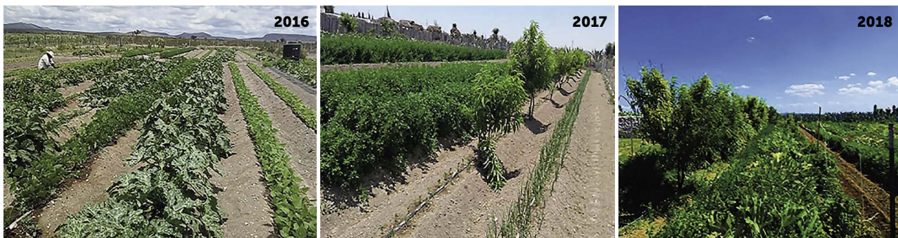
Figura 2. Rotación de cultivos en el módulo agroforestal localizado en la localidad El Hospital, Charcas, San Luis Potosí, México.