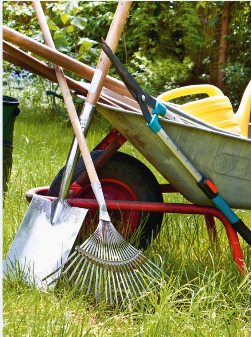
Dem Befähigungsansatz liegt das Gleichnis der drei Gärtner zugrunde.

Schliesslich sind auch kulturelle Werte und Normen der regionalen Bevölkerung von Bedeutung, wenn es um den Zugang zu gesellschaftlichen Positionen geht. Gewisse unveränderliche Merkmale einer Person beeinflussen, wie sie von der Gesellschaft wahrgenommen wird und welche Eigenschaften ihr dadurch zugeschrieben werden. Dies sind beispielsweise Jahrgang, Herkunft und Geschlecht.