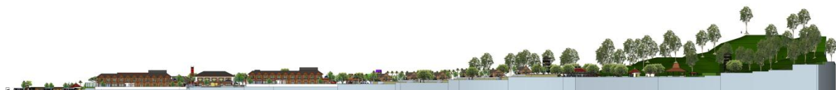
Tampak Samping Kiri