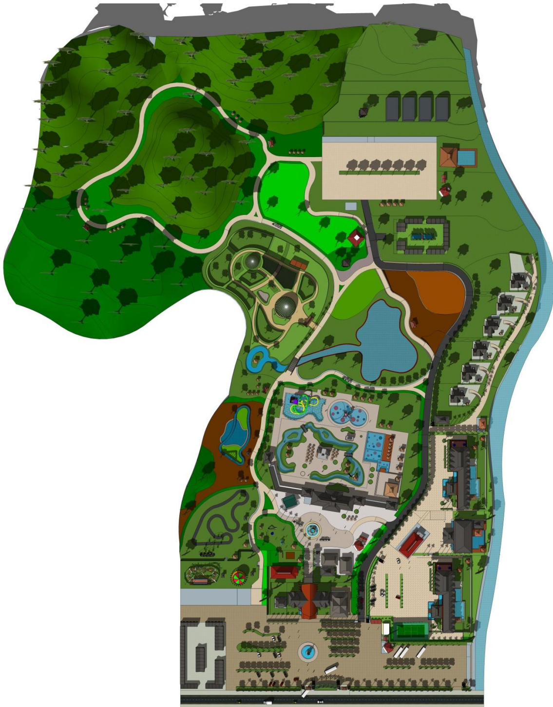
Site plan wisata kopeng