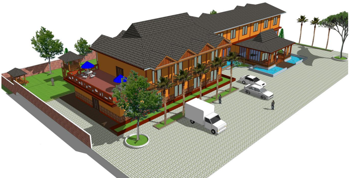
Tampak Perpektif Hotel