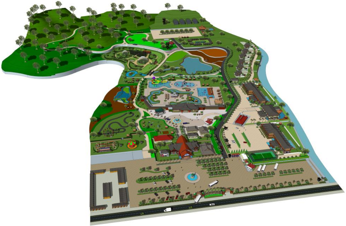
Prespektif Depan Kawasan Wisata