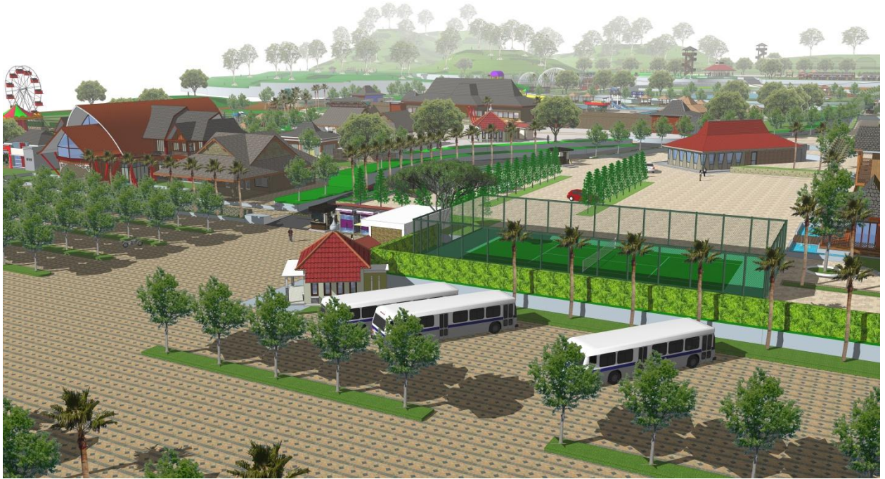
Prespektif kawasan wisata